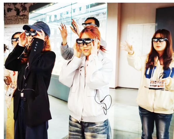
年轻观众在黄冈市博物馆佩戴AR眼镜沉浸式观展。