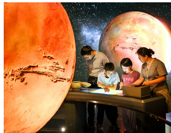
“走!去建设火星”硬核科幻行星科学体验展全网曝光量破亿,图为观众在展厅参观。

从石家河文化到曾侯乙礼乐,从本土珍藏到异域风物,从线下特展到云端直播,2026年国际博物馆日湖北系列活动,以馆为桥,融通内外,以守正创新的实践讲好中国故事,推动人类文明交流互鉴,助力构建人类命运共同体。