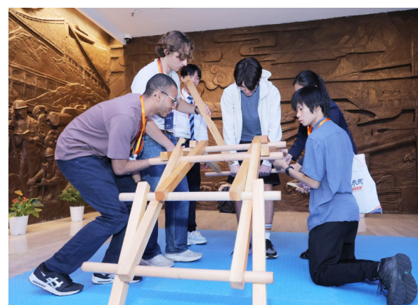
中外青年共搭大桥。