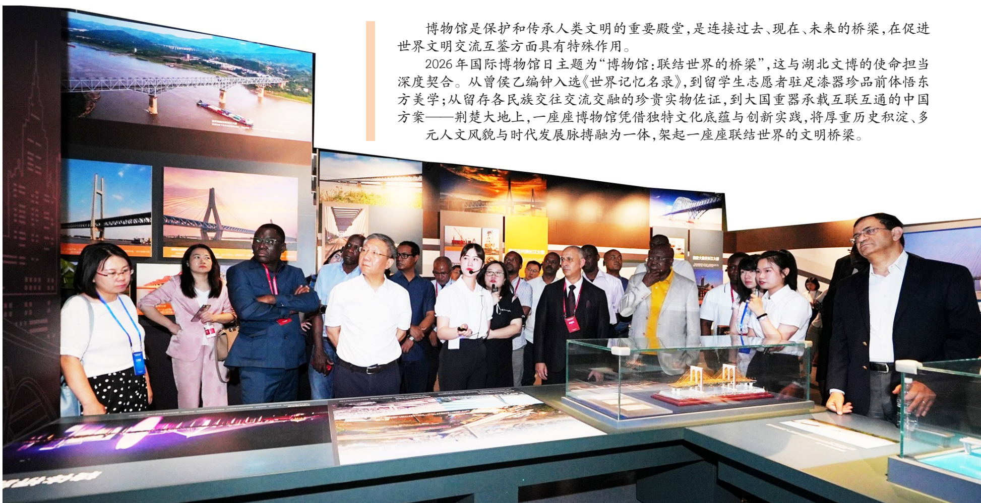
桥梁博物馆接待中非论坛外宾参观。