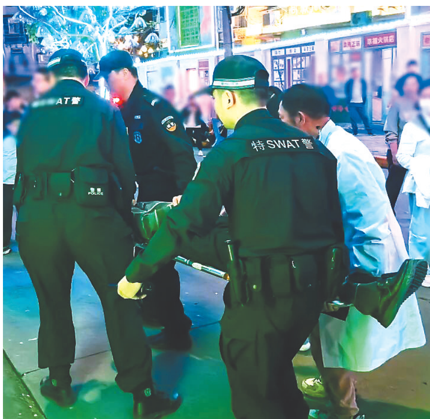
民警和医护人员开展紧急救助。