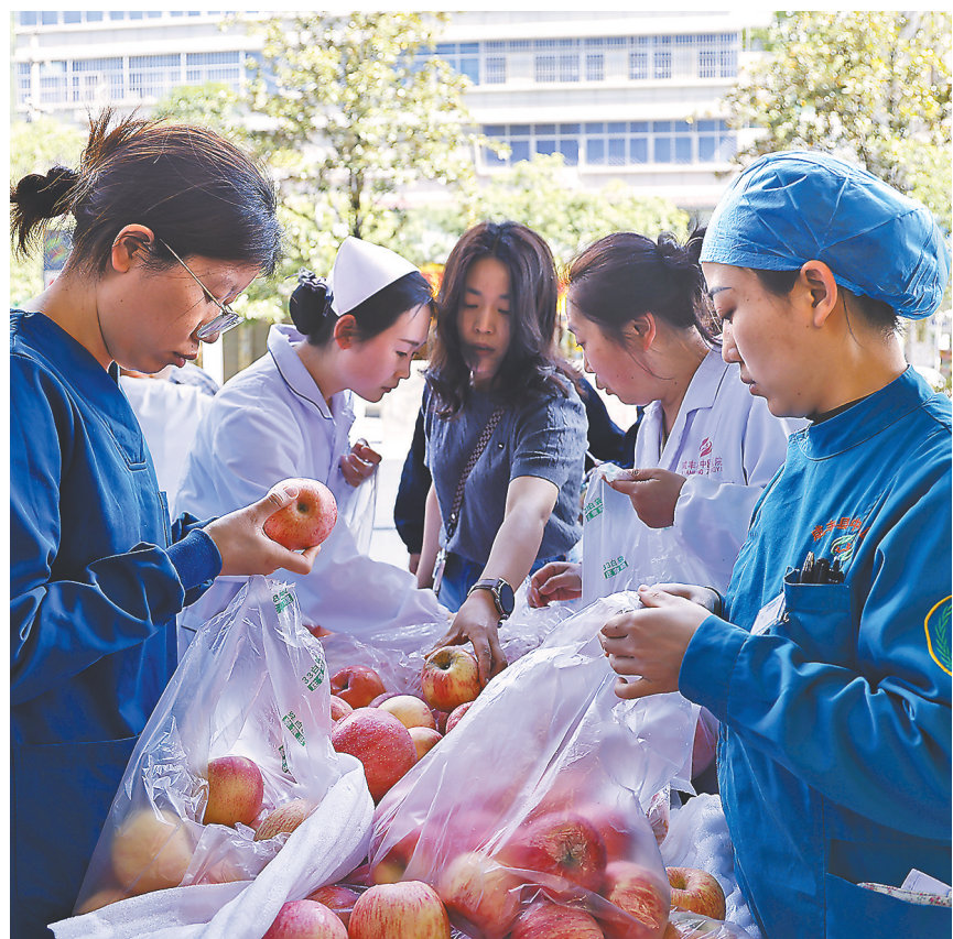
热心市民和医护人员购买苹果。