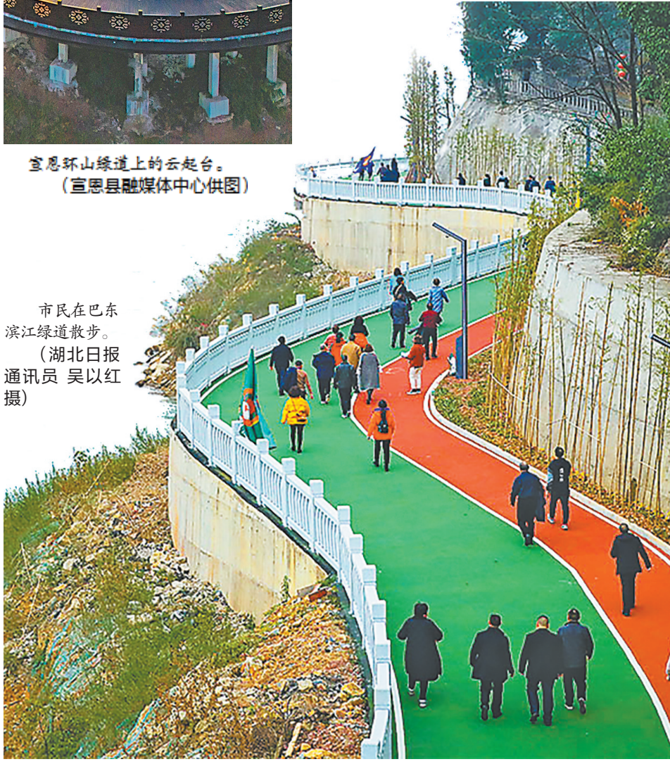
市民在巴东滨江绿道散步。