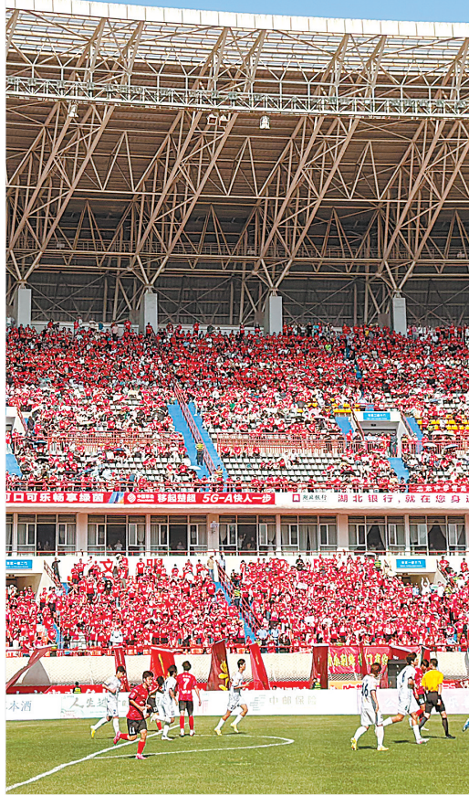
国产AS700“祥云”飞艇悬停在球场上空。