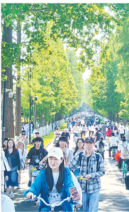
“五一”假期,东湖绿道开启“人从众”火爆模式。