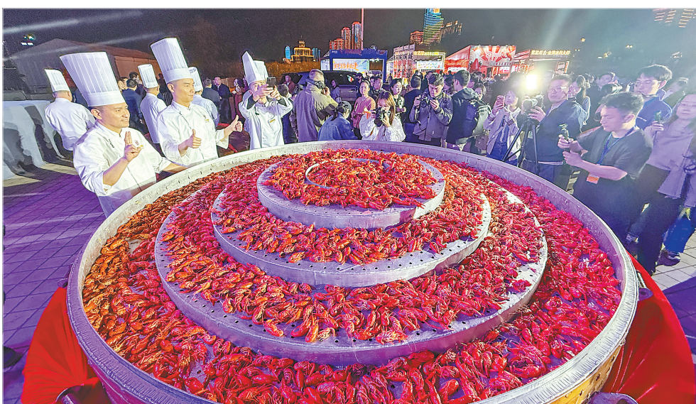
4月30日,巨型蒸锅震撼揭开,万只鲜美的小龙虾热气腾腾端上桌,武汉市民和游客畅享“喂虾”乐趣。