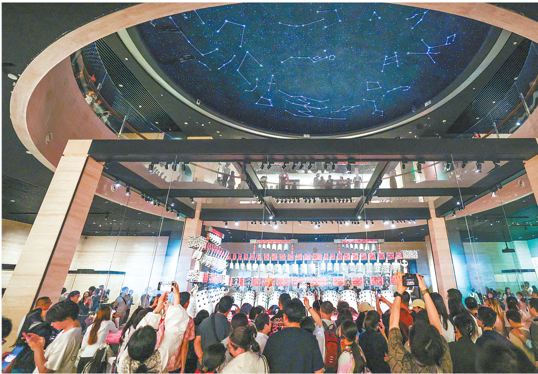
5月4日,湖北省博物馆人气持续火爆,“五一”假期门票连续5天约满。