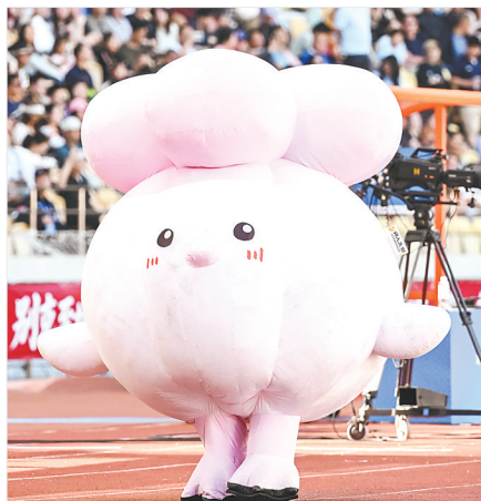
5月4日,武汉华工科技队主场迎战咸宁队。在中场休息时,武汉文创“蒜鸟”出场,萌翻众人。

未来,随着楚超联赛持续推进,依托体育赛事动能,我省文旅资源和消费潜力亦将扩展蔓延,更具澎湃活力的体育文旅繁荣共生的新篇章,正在书写。