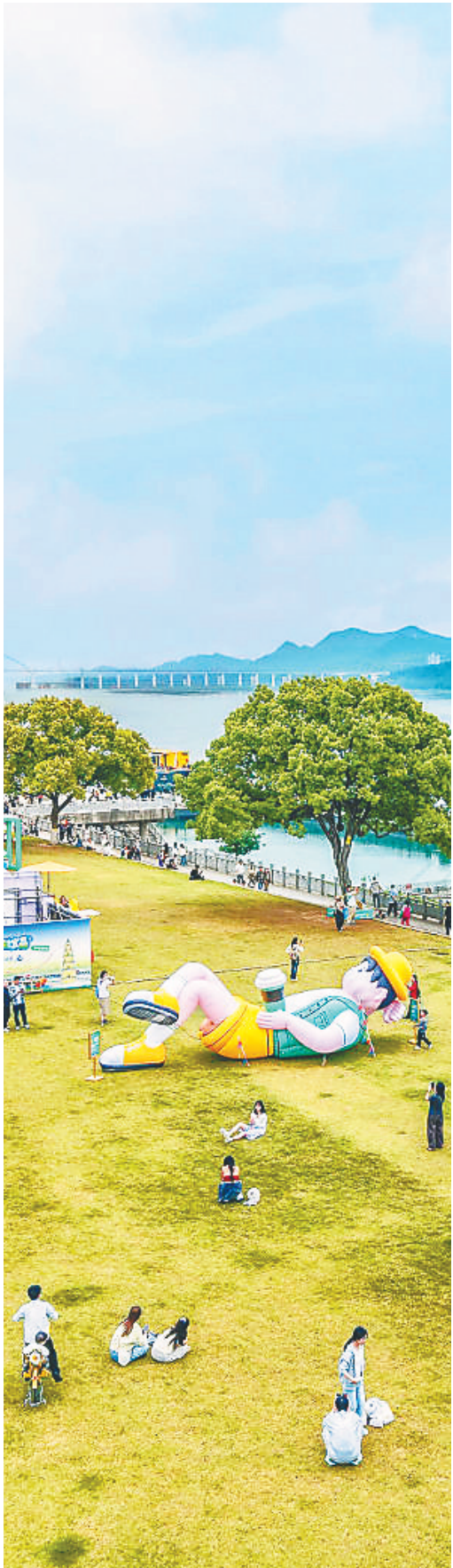
宜昌滨江公园,市民和游客尽享好风光。

随着屈原足迹漫步滨江,在高山草原解锁零碳旅行新方式,搭乘定制小包团感受城市烟火……汉襄宜“一小时高铁圈”闭环后的首个“五一”假期,大批武汉、襄阳青年游客奔赴宜昌,宜昌变了“YOUNG”。