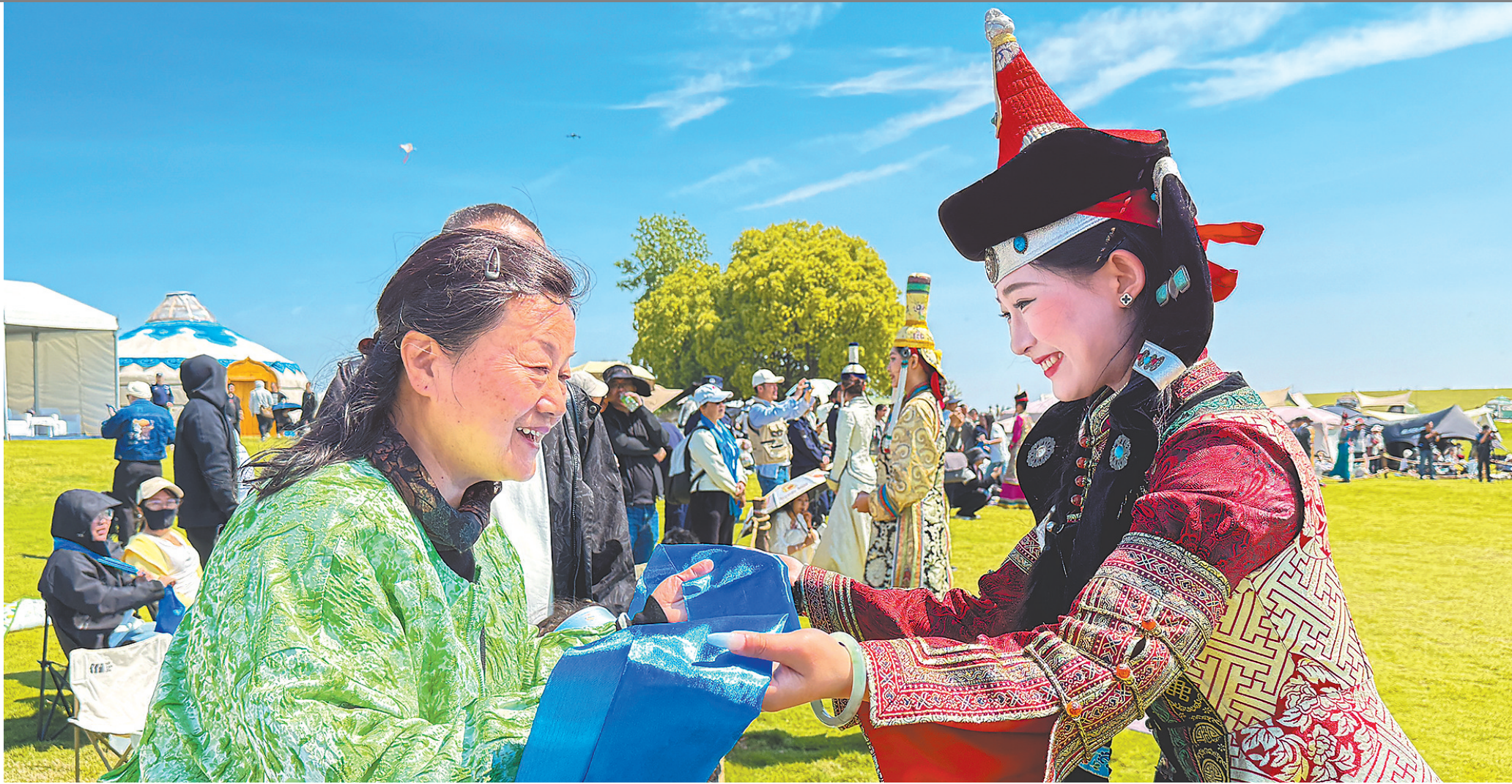
5月1日,第二届“武锡真情·木兰草原那达慕大会”在武汉黄陂木兰草原景区拉开帷幕。

从花展联想到文旅联动,汉襄宜“金三角”正以抱团姿态,打造区域文旅协同新样本,为荆楚文旅高质量发展注入新活力。