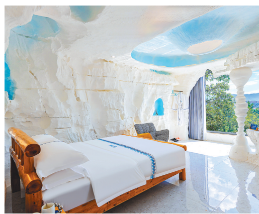
恩施市天机洞穴温泉民宿。