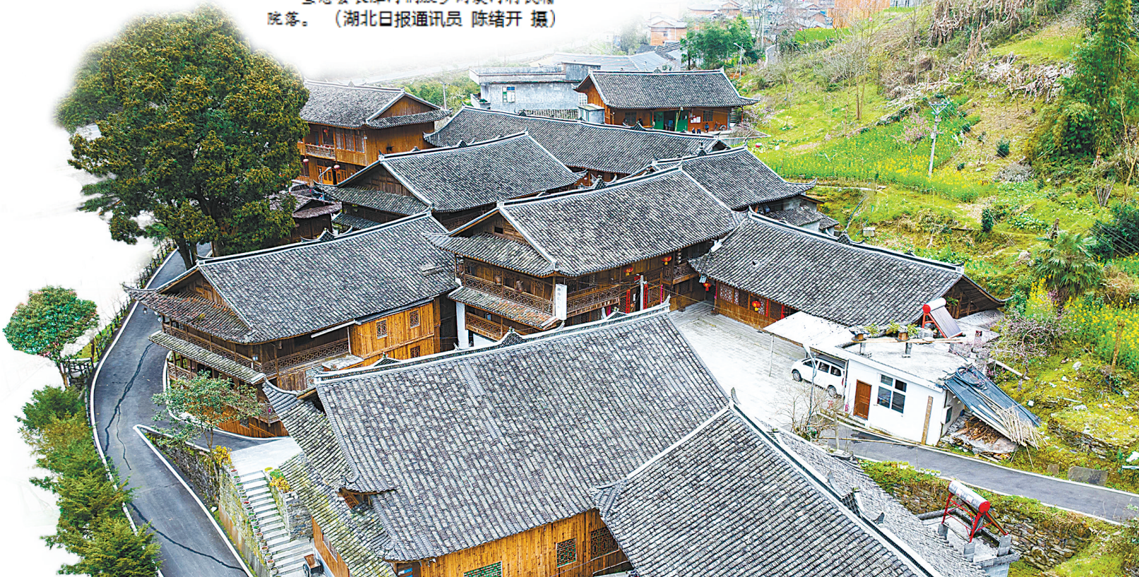
宣恩县长潭河何家乡两溪河村民宿院落。(湖北日报通讯员 陈绪开 摄)