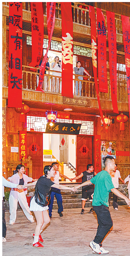
游客在恩施市盛家坝镇二官寨村“△村居”民宿体验篝火晚会。

开业之初，民宿凭借“离尘不离城”的区位优势，迅速成为网红打卡地，连续两年营业额突破200万元。旺季客房价格达1000至1200元一晚，一度出现一房难求的盛况。2025年2月，天机洞穴民宿荣登全国甲级旅游民宿榜单。