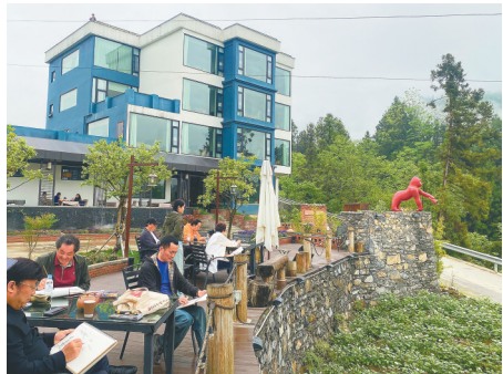
恩施市半山观云民宿组织采风活动。

为进一步推动民宿产业规范、高质量发展，恩施州正加紧推动《恩施州乡村民宿发展条例》出台，开展“寻找最美民宿”活动，贯彻落实旅游民宿国家标准，打造魅力乡居民宿品牌。按照长远规划，恩施州将力争打造1万家以上避暑康养民宿，推动民宿与文旅、康养、农业等产业深度融合，让一间间民宿成为激活乡村、富裕农民、繁荣土土的强劲引擎。