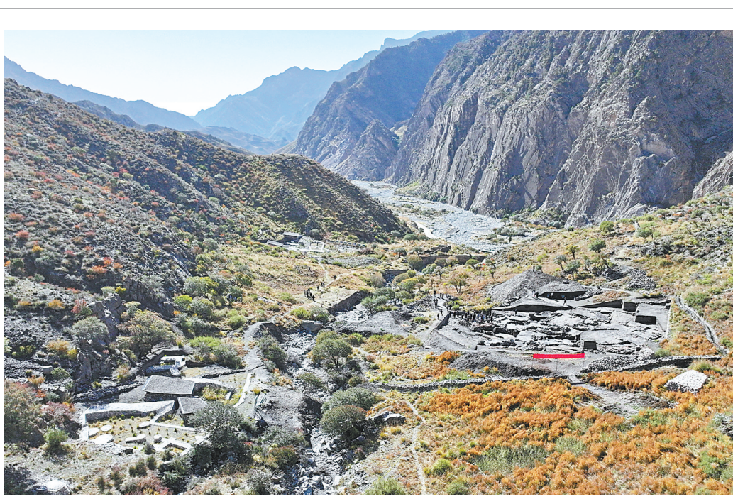
2025年10月13日拍摄的宁夏贺兰苏峪口瓷窑址全景。

习近平强调,要认真抓好防灾减灾救灾责任落实。各地区各有关部门要守土尽责,坚持统分结合、防救衔接,上下联动,推动形成齐抓共管、协同配合的工作格局。树立和践行正确政绩观,坚决纠正重发展轻安全、重救灾轻预防等倾向。加强教育培训,提高各级干部的防灾减灾救灾能力。