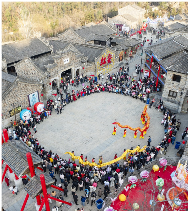
黄安古城·红安影戏城演出现场。