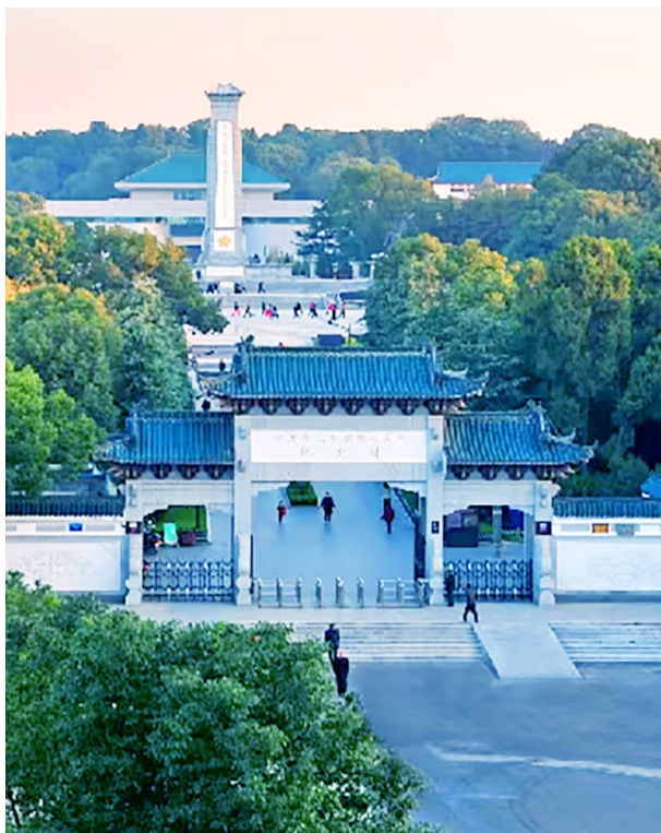
黄麻起义和鄂豫皖苏区纪念馆。

扎根人民、无私奉献,是两大精神共同的初心底色。人民是革命的根基,奉献是党员的本色。大别山革命能够坚守二十八年,核心在于始终依靠人民、扎根群众,红安百姓倾家荡产支援红军、掩护战士、守护根据地,用全民奉献筑牢革命根基。万里长征的胜利,同样源于军民同心、鱼水情深,百姓倾力相助、军民生死与共,支撑红军跨越绝境、完成远征壮举。红安“家家烈士、户户忠魂”的悲壮过往,深刻印证了大别山精神与长征精神源于人民、为了人民、依靠人民的本质,让为民奉献、家国担当成为两大精神亘古不变的价值内核。