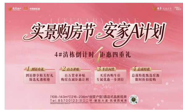
“实景购房节 安家A计划”活动海报。