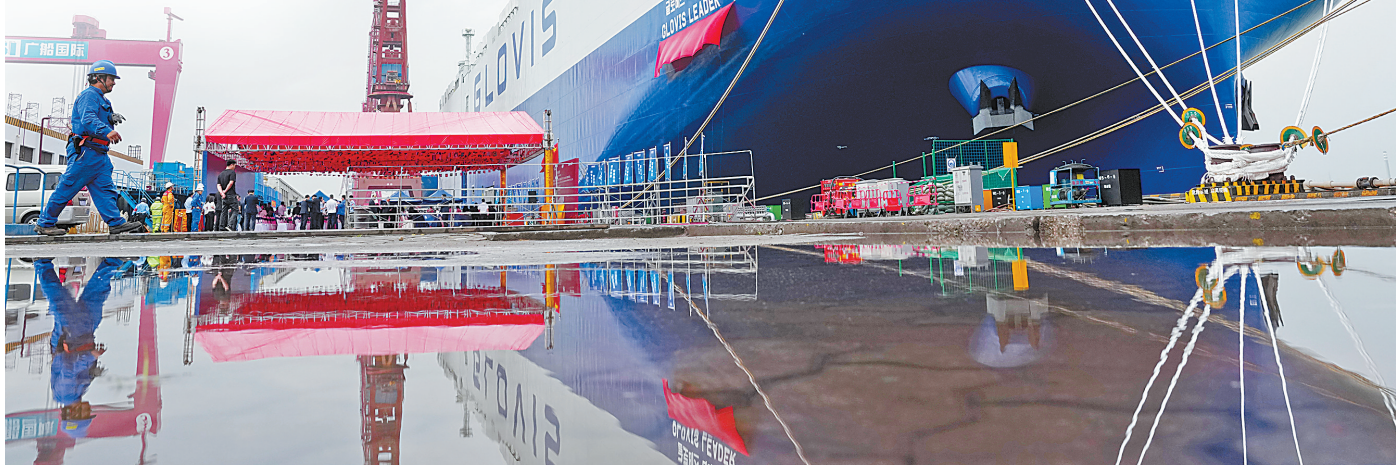
4月28日,全球首艘10800辆汽车运输船(PCTC)“格罗唯视 领航”轮在广州南沙命名交付。

28日,由我国造船企业自主建造的全球最大汽车运输船在广州南沙交付。该船最大装车量达10800辆,刷新全球同类船舶运力纪录,标志着我国高端船舶制造能力实现新突破,为全球航运业绿色低碳转型提供了“中国方案”。