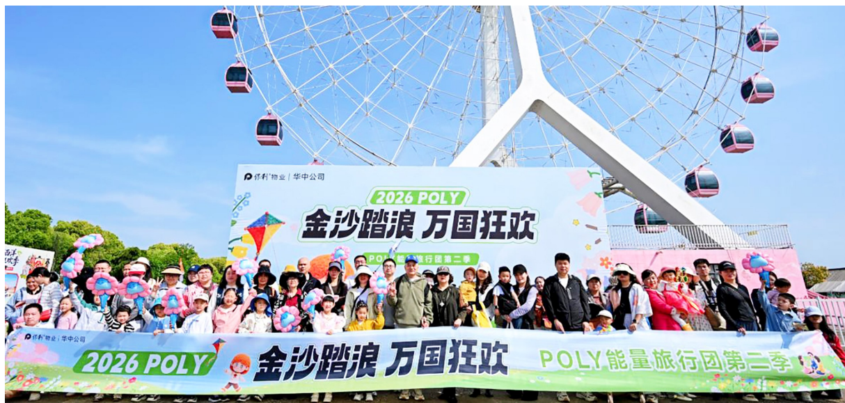
“金沙踏浪 万国狂欢”——POLY能量旅行团第二季在梁子湖龙湾半岛举行。

春和景明,正是出游好时光。4月25日,保利物业华中公司在梁子湖龙湾半岛举办“金沙踏浪 万国狂欢”——POLY能量旅行团第二季主题活动,吸引数百名业主参与。这不仅是企业践行年度“品质向新”升级计划的缩影,更是以贴心服务提升居民幸福感的生动实践。