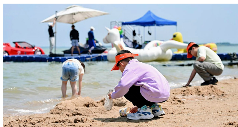
小业主们积极参与捡垃圾。

保利物业华中公司相关负责人表示,未来将继续坚守“善治善成服务民生”的企业使命,聚焦业主对美好生活的需求,持续升级服务品质,将更多元的文化活动、更精细的物业服务带入社区,与业主携手共赴美好生活新旅程。