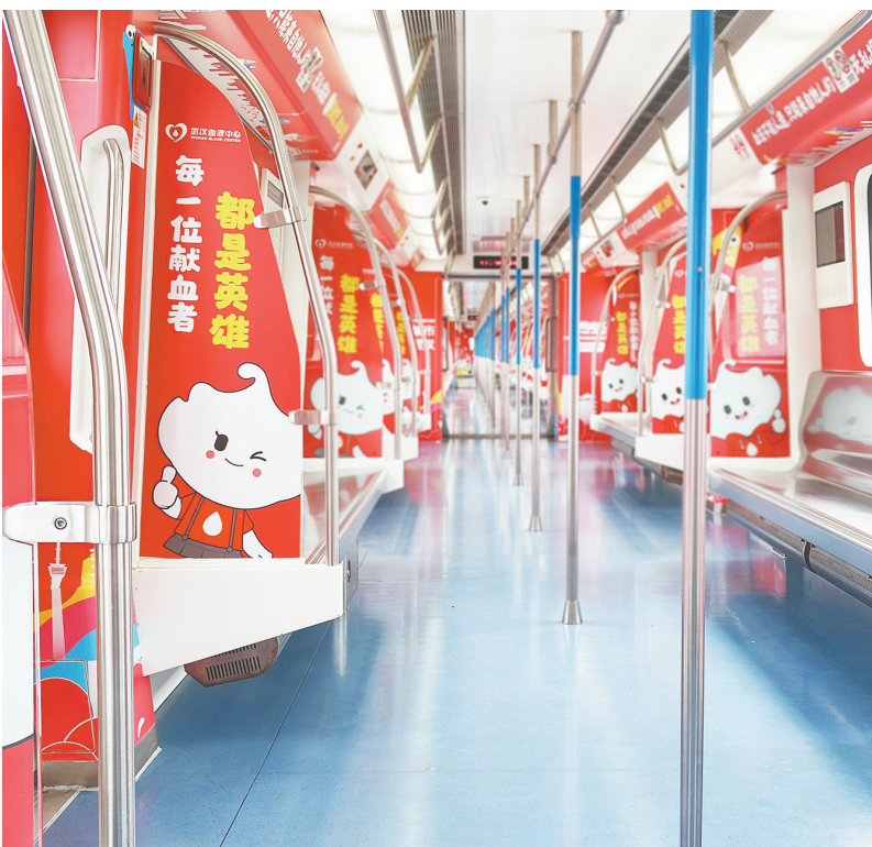
每一节车厢内都写有无偿献血科普知识。