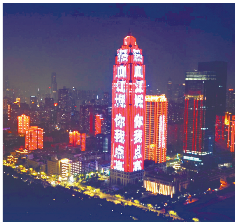
世界献血者日主题灯光秀为无偿献血者点亮。