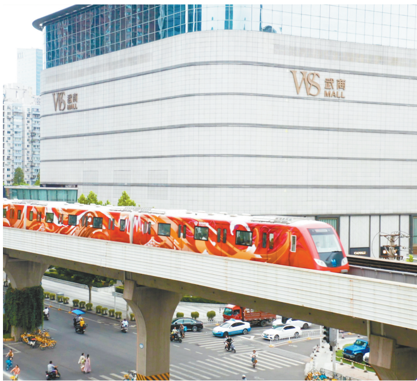
全国首个“英雄红”无偿献血主题涂鸦列车。

从优先用血的绿色通道,到血费减免的“一次都不跑”;从“四免”政策的温情落地,到智慧献血的科技赋能——武汉交出了一份让献血者满意的答卷,让每一份热血都有了温暖的回响。