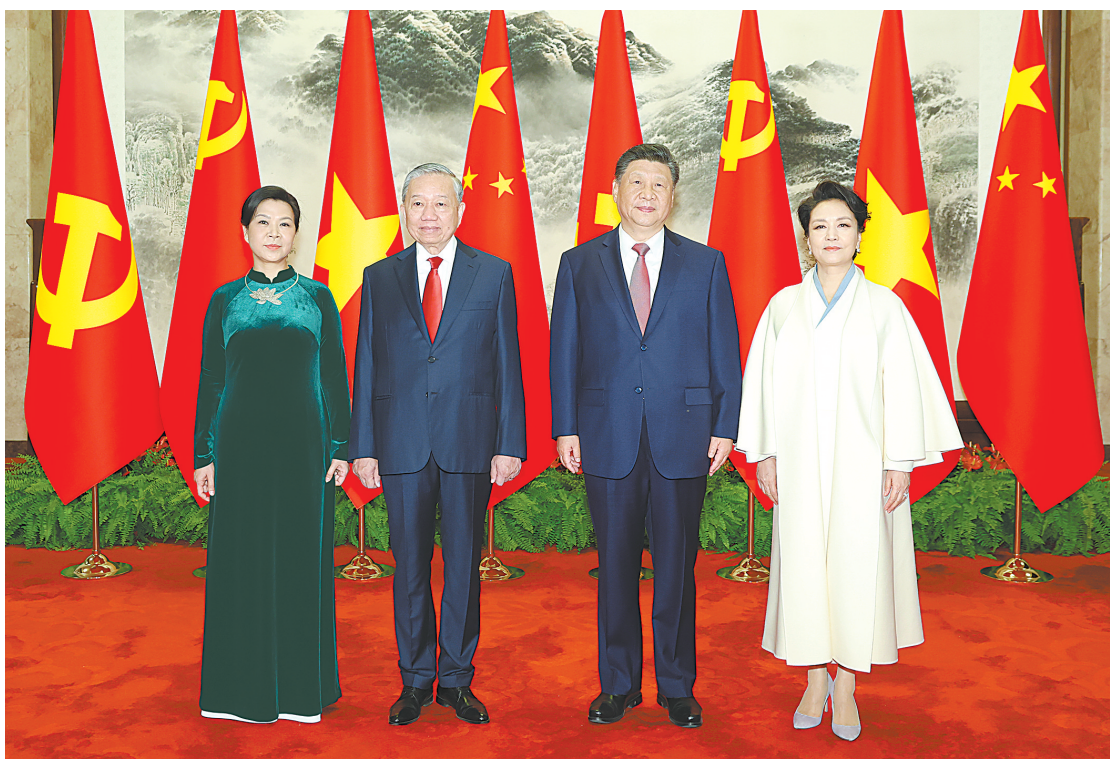
四月十五日上午,中共中央总书记、国家主席习近平在北京人民大会堂同来越共中央总书记、国家主席苏林夫妇在北京人民大会堂举行会谈。这是会谈前,习近平和夫人彭丽媛同苏林和夫人吴芳瑞合影。

新华社北京4月15日电 4月15日上午,中共中央总书记、国家主席习近平在人民大会堂同来越共中央总书记、国家主席苏林夫妇在北京人民大会堂举行会谈。