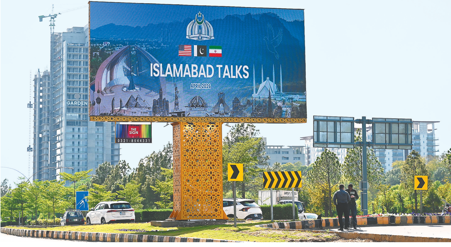
4月10日在巴基斯坦伊斯兰堡拍摄的美伊会谈的大型户外广告牌。

美国和伊朗4月11日在巴基斯坦首都伊斯兰堡举行谈判。从双方此前公开表态看,美伊几乎所有核心诉求均存在对立或重大分歧,甚至越过彼此划定的“红线”。其中,三大焦点议题最受关注也最棘手:霍尔木兹海峡、伊朗浓缩铀、黎巴嫩真主党等伊朗支持的地区抵抗阵线。