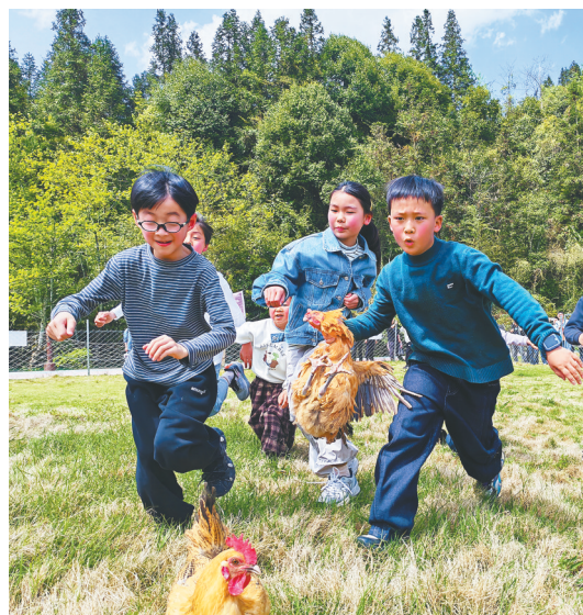
来凤县“春日桃花季”暨营地生活节活动现场。

拓展发展格局:推动“花经济”与全域旅游融合,打造“核心景区+花海”精品线路;发挥湘鄂渝黔交界优势,深化跨省协作,共享客源,让恩施“花经济”融入大武陵、大三峡旅游发展格局。