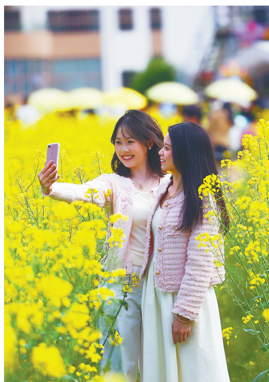
“堂里塘外”田园综合体,游客拍照留念。