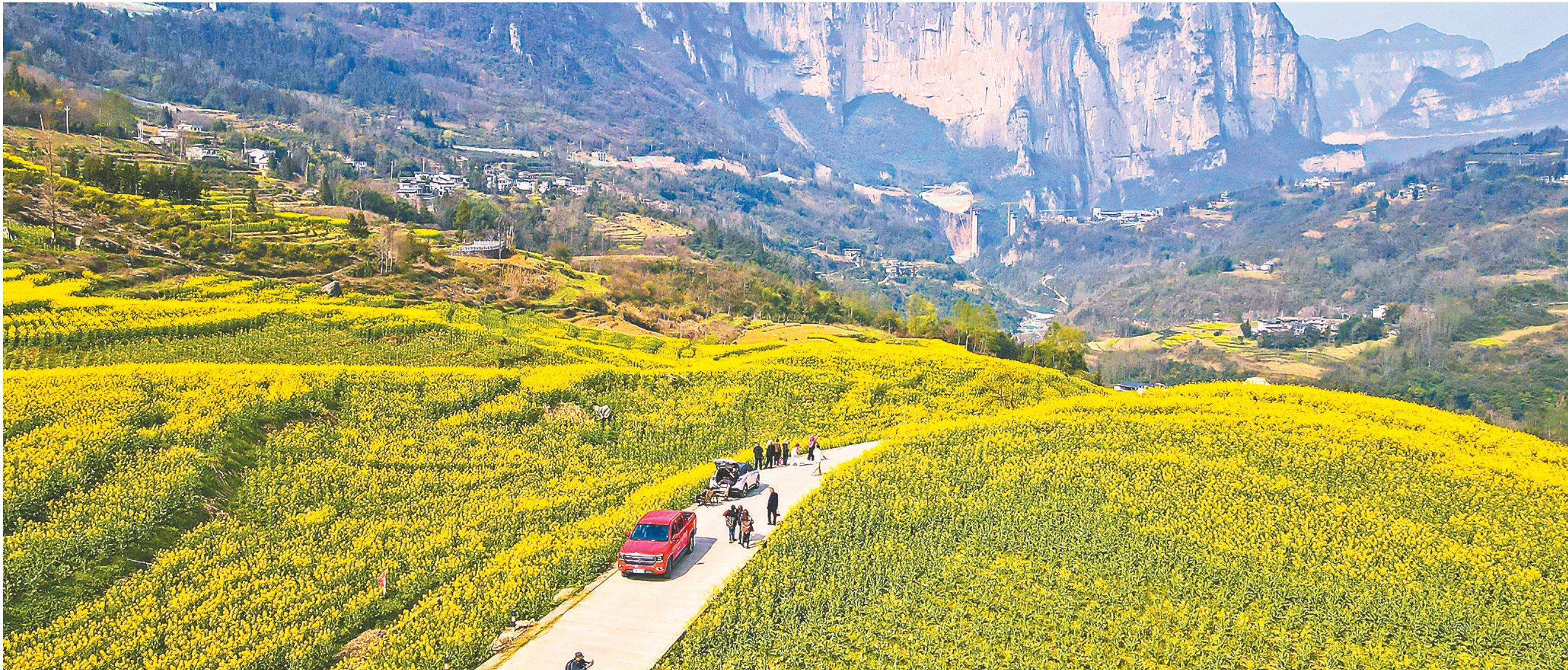
恩施市屯堡乡田凤坪村的绝壁花海。