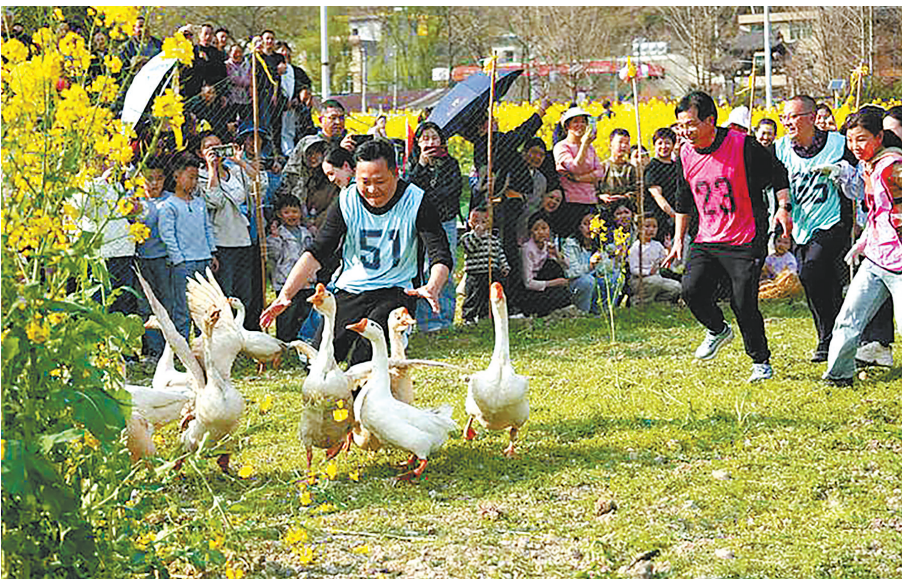
游客在油菜花海参加抓大鹅比赛。

阳春三月,春潮涌动武陵山。咸丰将多元体验与传统文化融入春景,以景观客、以情留客,让短暂的春日“流量”,稳稳转化为文旅赋能、乡村振兴的持久“留量”。