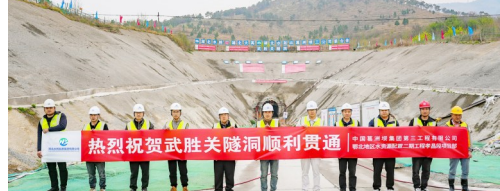
水发集团庆祝武胜关隧洞顺利贯通。