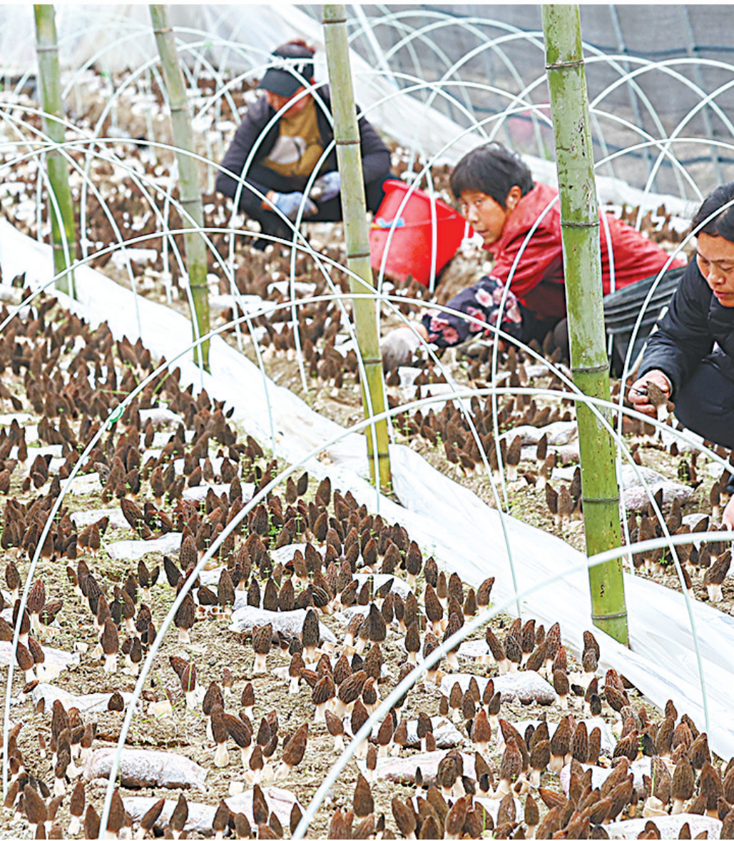
种植户正在采摘羊肚菌。