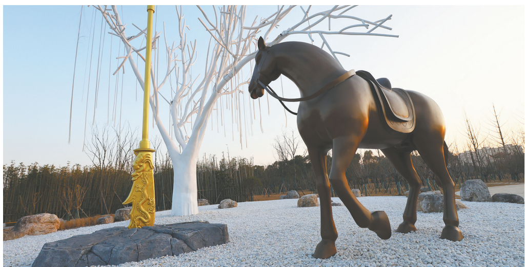
关陵文化遗址公园一角。

从最初民间自发组织的关陵庙会，到如今成为省部级保留的重点节庆活动，当阳用坚守与创新证明，这座忠义古城已然找到属于自己的时代节拍，“中国义城”将在湖北加快建设中部地区崛起重要战略支点的征程中，贡献更多当阳力量、展现更多当阳作为。