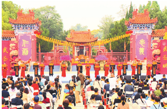
2025关公文化旅游节礼拜仪式。

与湖北大学深入合作，持续开展学术研究，常态化举办“海峡两岸关公文化学术交流”活动，汇聚顶尖学者，围绕关公文化的传承与发展、时代价值与当代转化等课题深入研讨，为“关圣文化史迹”联合申报提供智力支撑。启动“天下关公”数字资源中心”项目建设，运用数字化技术对关公文化相关文物、传说、史料等资源进行系统整理、归档与展示，让关公文化在数字时代焕发新生。