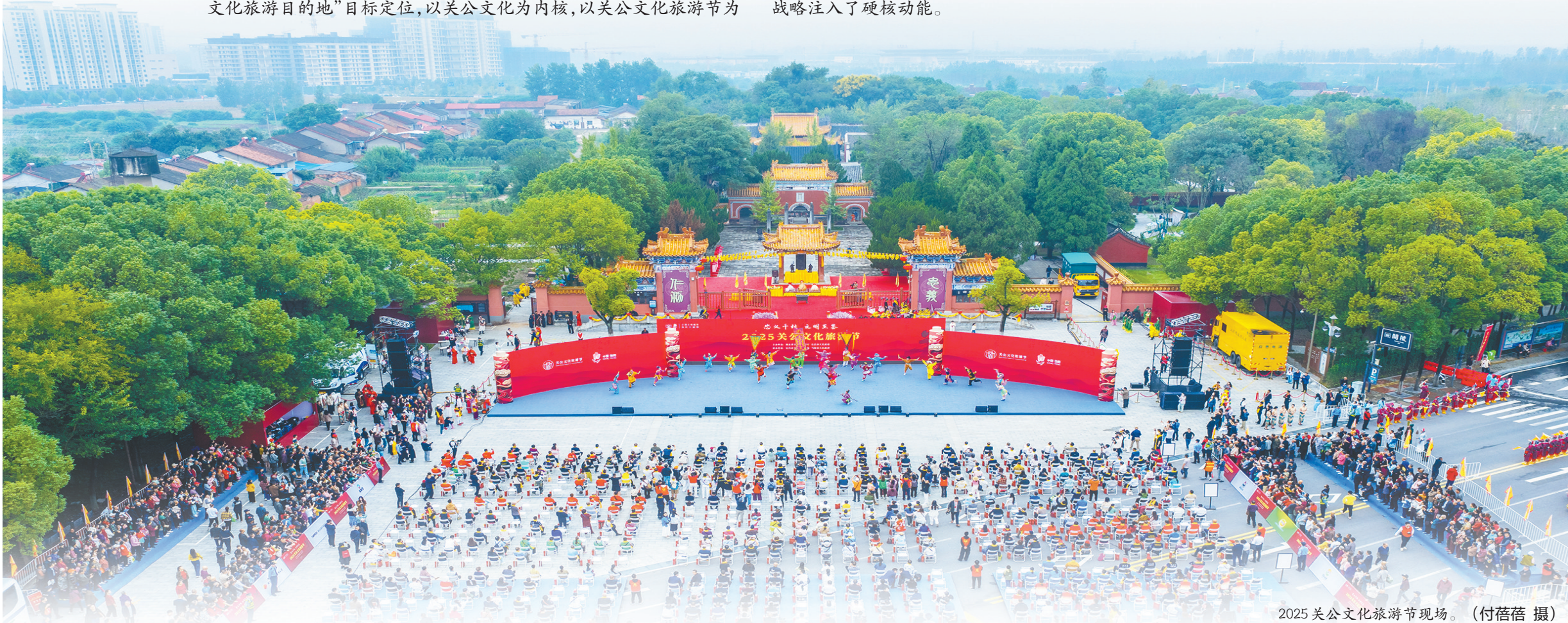
2025关公文化旅游节现场。

支撑，探索出“以节兴城、以文兴产、文旅融合”的高质量发展新路径，为擦亮“中国义城”城市品牌、助力冲刺全国百强、赋能湖北文旅强省战略注入了硬核动能。