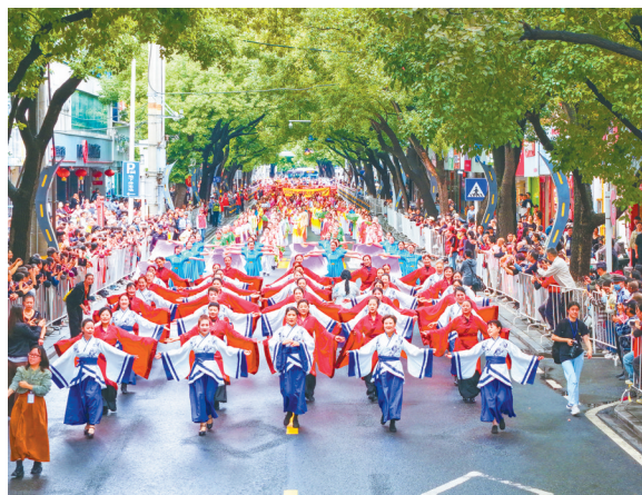
2025关公文化旅游节巡游活动。