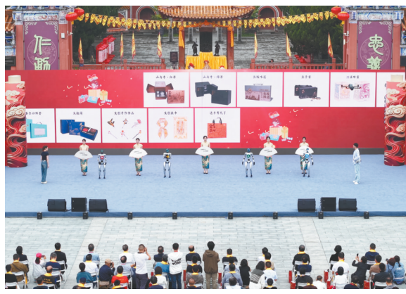
当阳文创品牌亮相关公文化旅游节。

搭建节会平台，凝聚发展合力。依托节会平台举办“楚商回乡 共建支点”交流会，签约18个项目，涵盖文旅融合、智能制造、现代农业等领域，签约项目投资额达172.9亿元。开展“群英荟萃 智聘三国”招聘会，30家企业通过“线下招聘+线上直播+互动体验”新模式，提供千余个岗位，达成就业意向153人。直播带货吸引3.2万人次观看，打造人才集聚“强磁场”，为产业可持续发展注入了新动能。