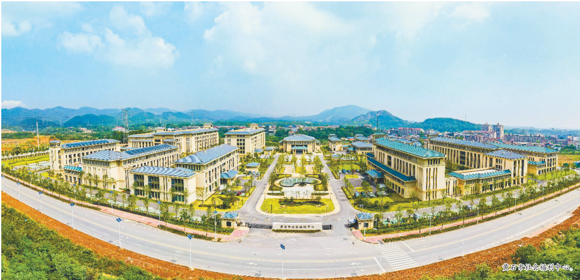
黄石市社会福利中心。

互助养老蔚然成风。全省注册老年志愿者超80万人,累计服务时长超5000万小时。宜昌市“时间银行”模式持续发力,武汉三民社区银发志愿服务队上门探访高龄老人,开展心理疏导,用爱心传递邻里温情。截至目前,全省建成138个全国示范性老年友好型社区,人口老龄化国情省情教育、“敬老月”、老年人权益保护宣传等活动常态化开展,尊老爱老助老的新风尚在荆楚大地愈发浓厚。