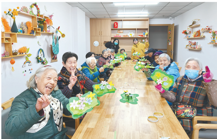
2025年12月12日,荆门市颐养院开展手工活动,锻炼长者动手能力。