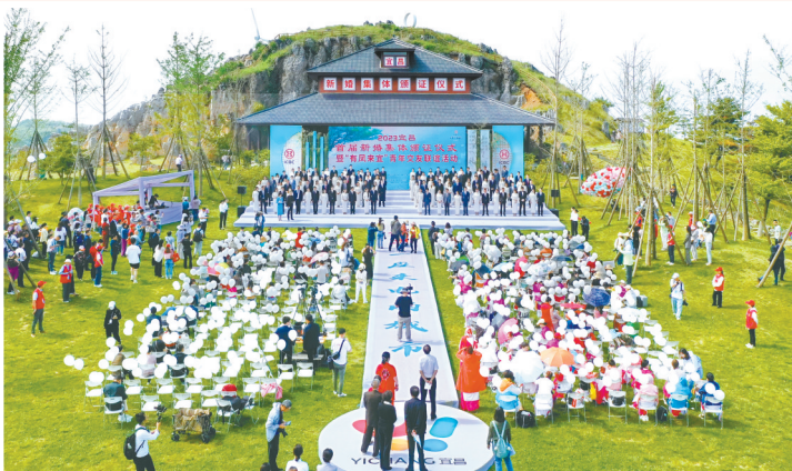
2023年5月20日,宜昌市首届新婚集体颁证仪式暨“有凤来宜”青年交友联谊活动,百对新人在云海山川见证下喜结良缘。