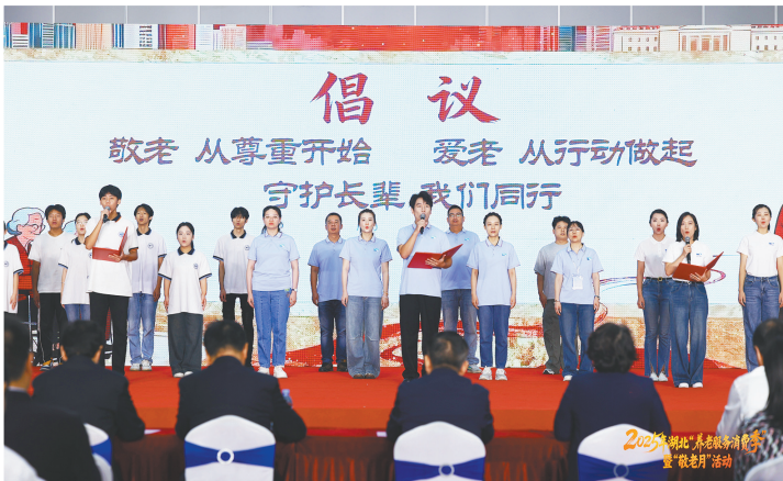
2025年湖北“养老服务消费季”暨“敬老月”活动启动仪式上,来自社会各界的团体代表共同发出倡议《敬老爱老 我们在行动》。

新征程上,湖北民政系统将以更实举措、更优服务,让群众的获得感更加充实、幸福感更可持续、安全感更有保障,为加快建设中部地区崛起重要战略支点贡献民政力量。