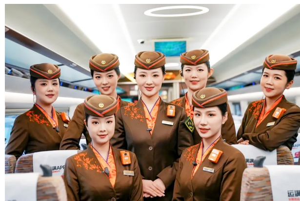
襄阳客运段精心选拔“龙韵骧梦”乘务组作为首发班组。

荆门市同步推出“高铁票变身文旅通票”活动。凭抵达当地的高铁票及身份证,可免费进入京山文峰公园网球场、市体育文化中心羽毛球馆、汉通游泳馆及京山天沐温泉等运动休闲场所。