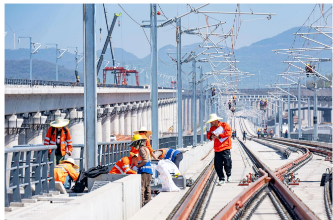
襄阳电务段信号工对荆门西站道岔设备进行调整。