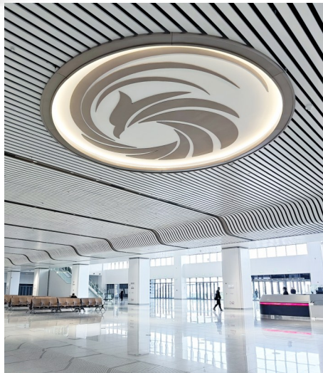
天门站候车厅。

为迎接沪渝蓉高铁武宜段开通,襄阳客运段成立宜昌北高铁乘务车间,打造“骧梦新程、宜途臻享”服务品牌,以“服务锦囊”为载体,提供“适宜”与“适怡”双轨场景服务。同时,武汉客运段精选20名乘务骨干组建5个标杆班组,全面开展专业实训,创新推行“宜路畅通、宜心同行、宜往无前、宜然自得”四个“宜”服务法,以高标准服务体系为新线运营护航。