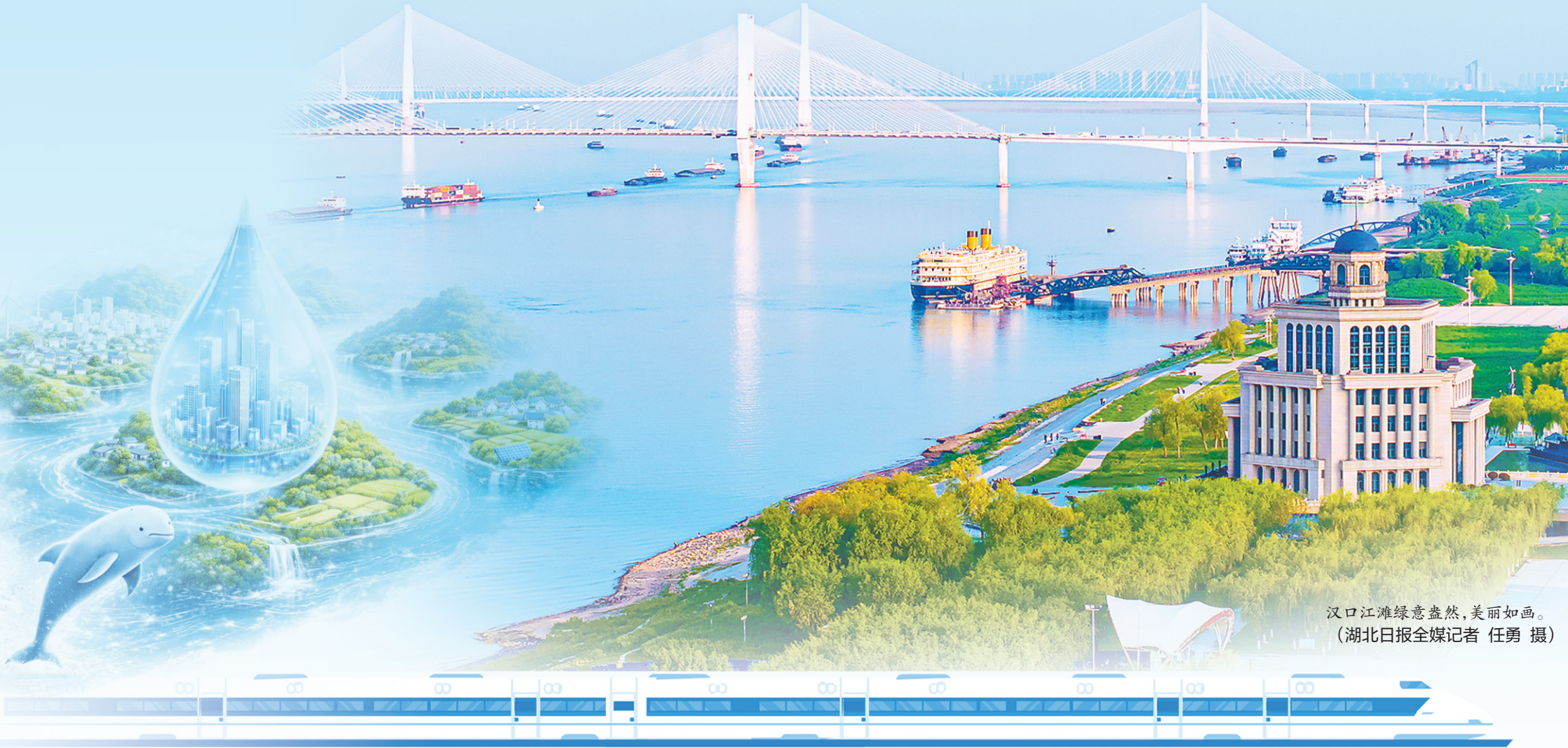
汉口江滩绿意盎然,美丽如画。

大江奔涌,不舍昼夜。当江风拂过焕发生机的岸线,江豚逐浪腾跃、麋鹿林间呦鸣,湖北正以坚定执着的行动,续写生态大省的绿色新篇。