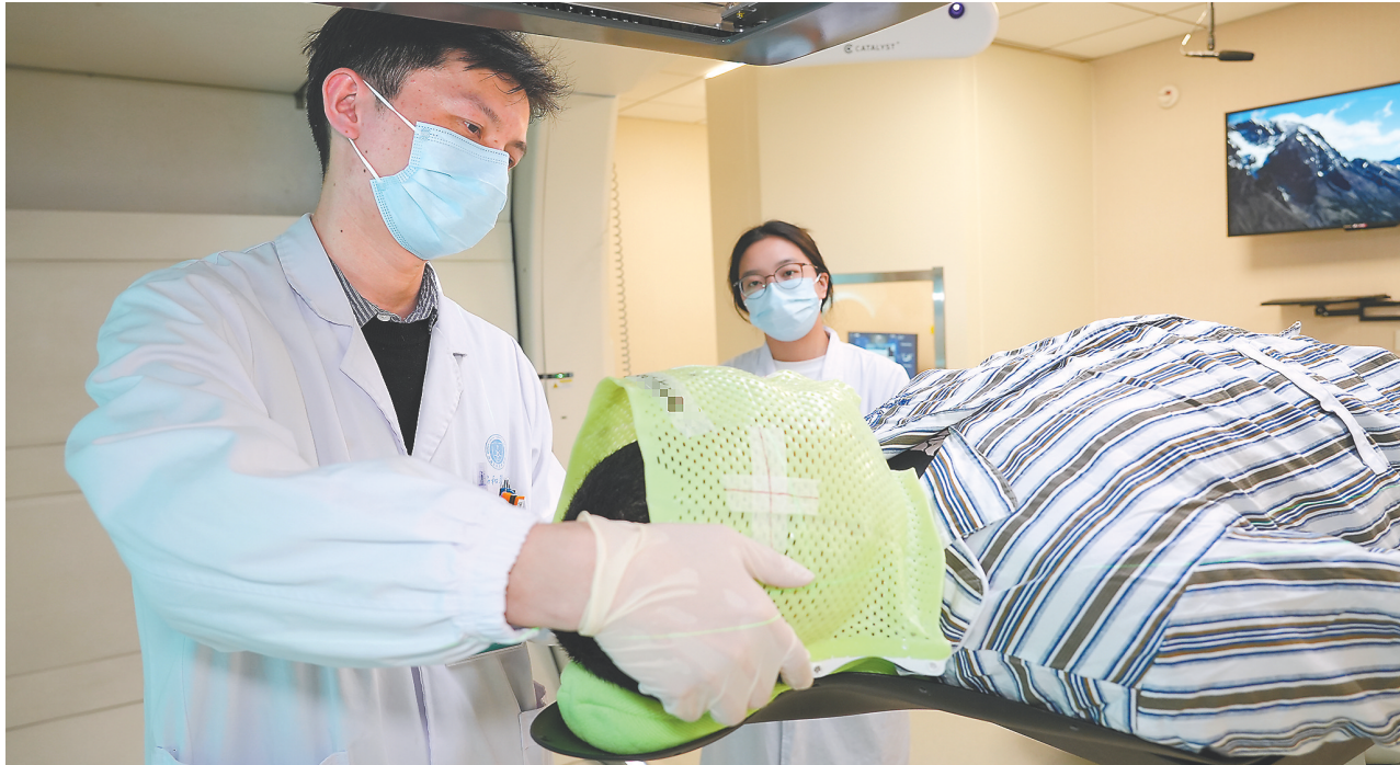
协和医院质子医学中心医生为患者进行质子放疗前的定位准备。

据了解，目前，国内外质子治疗一个疗程（通常持续5至6周，包含25至30次照射）的费用在20万至30万元之间，我省质子治疗一个疗程的临床指导价格为17.5万元，属于个人自费项目。启用当日，协和医院负责人宣布同步开展关爱行动：为经评估适合质子治疗的前100位儿童肿瘤患者（14岁以下），每人减免治疗费用2万元。