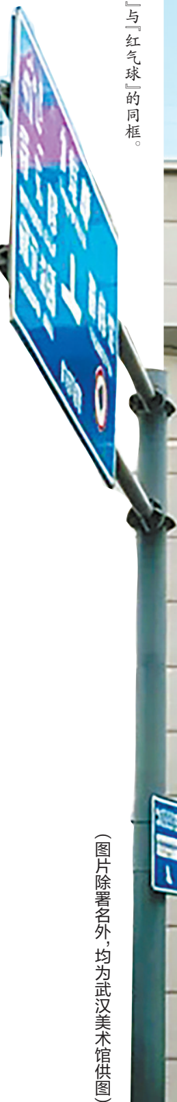
『粉红熊』与『红气球』的同框。

70多年后,戴泽的子孙戴孟和团队共同努力,将这幅平面作品“立”了起来,创作出衍生的雕塑作品,并赋予其全新的粉色彩色。