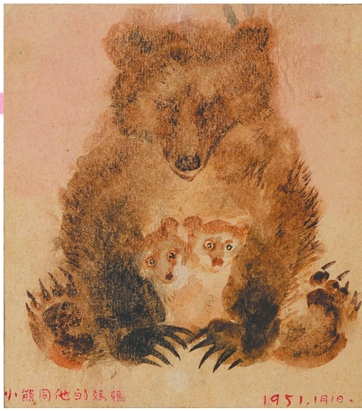
《小熊同他的妈妈》纸本水彩 1951年