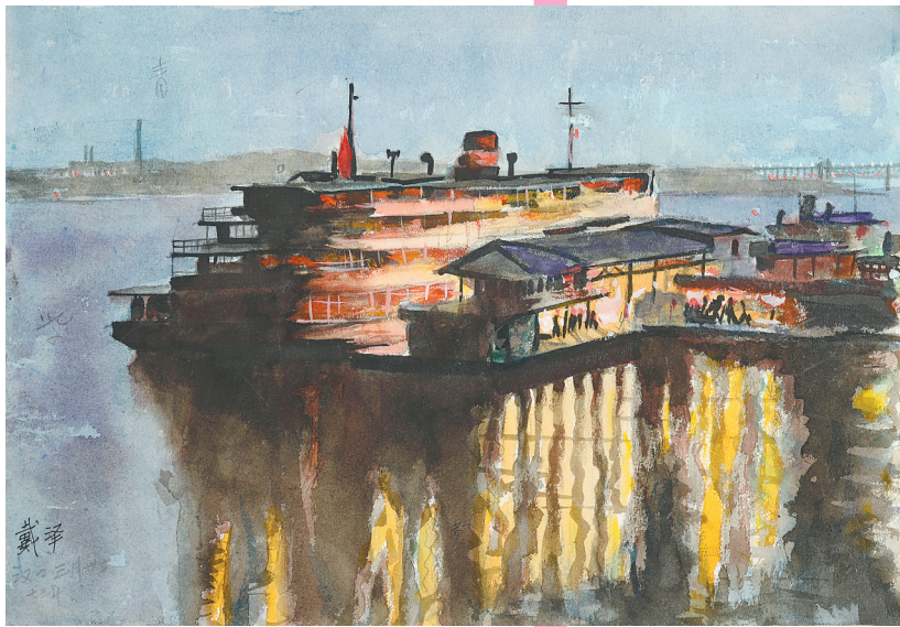
《汉口夜泊》 纸本水彩 1973年