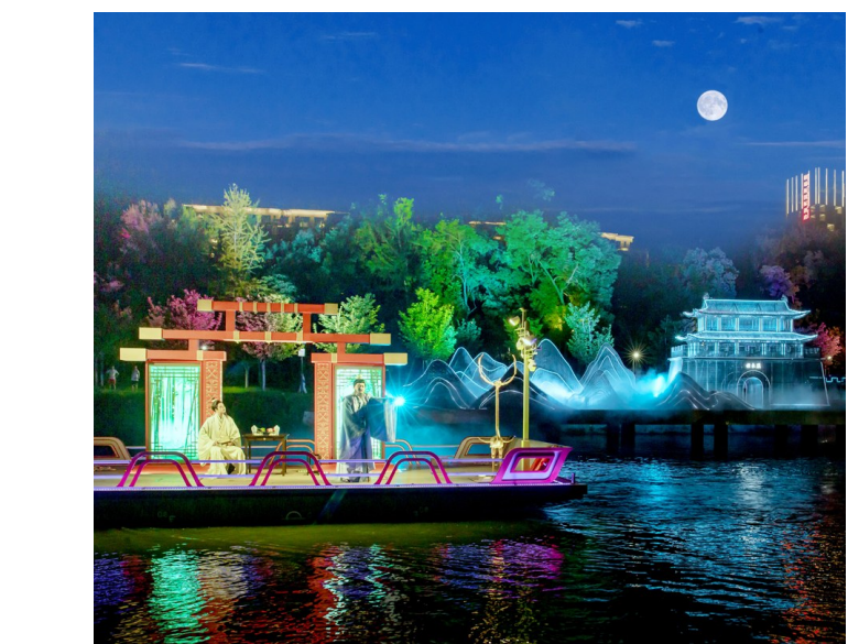
白云湖夜游，一场梦幻的水陆空光影联动。