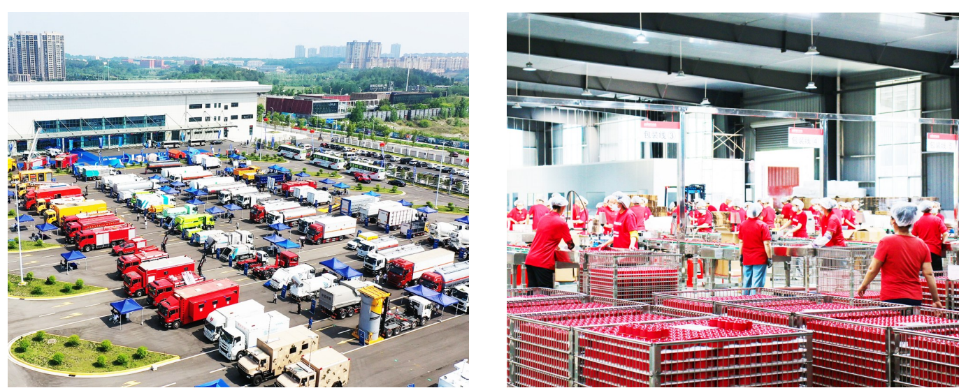
随州产各种专用汽车。