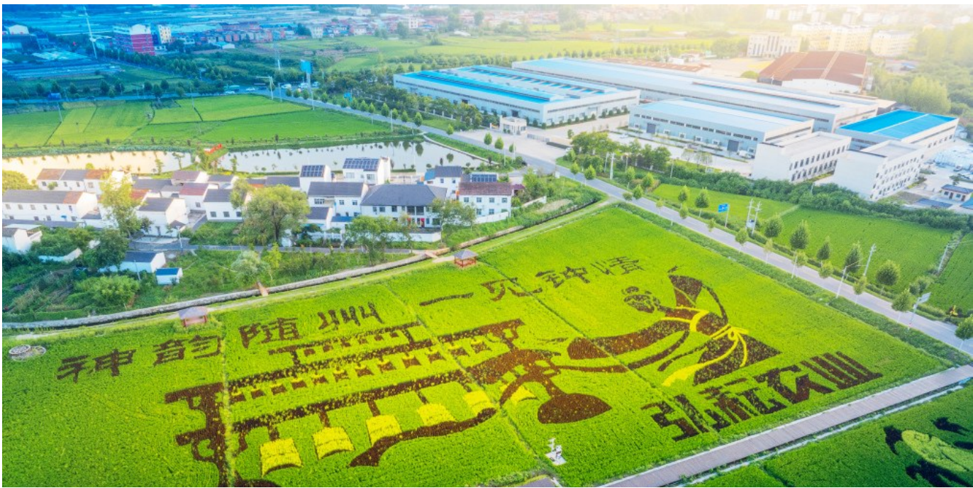
现代农业园区镶嵌在沃野。