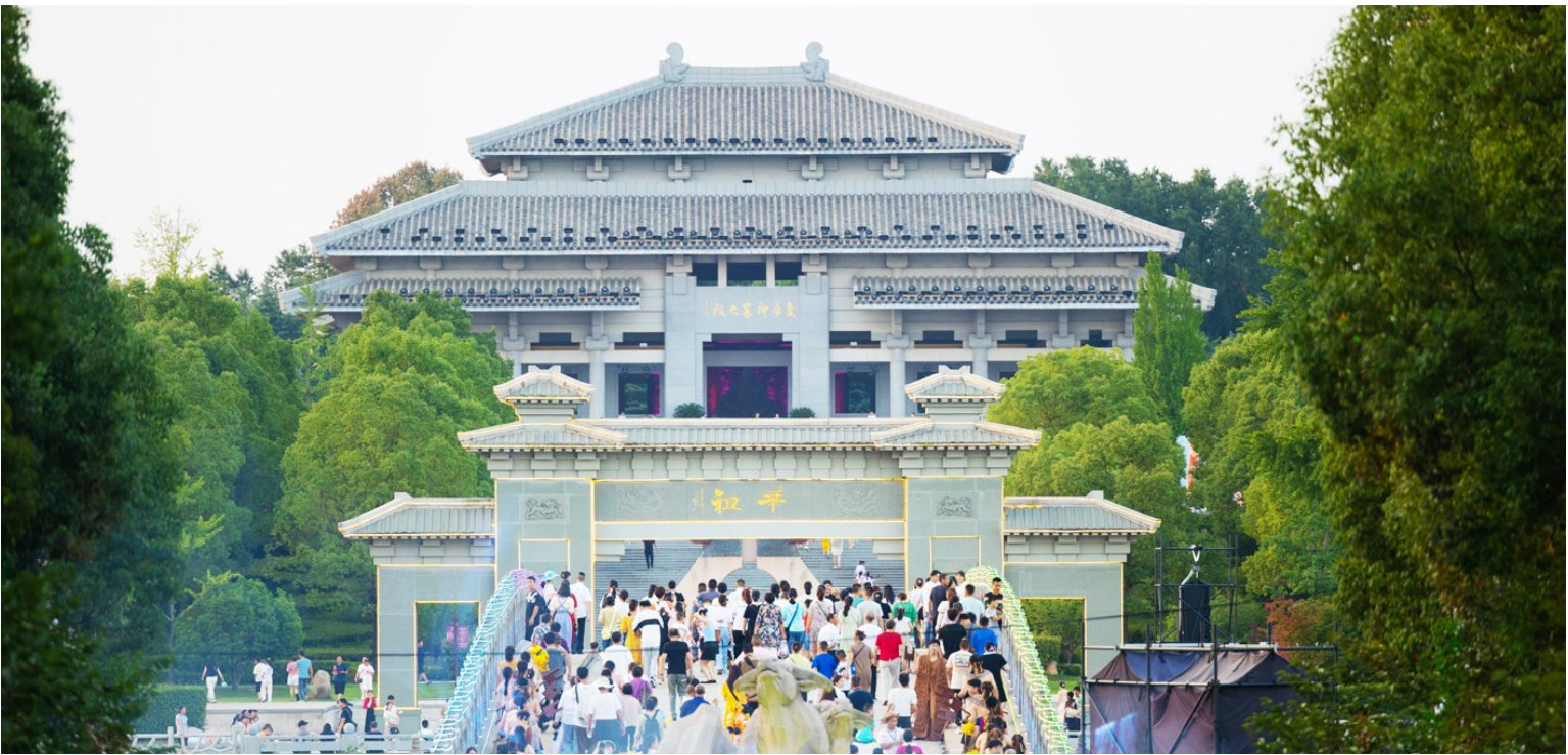
炎帝神农景区吸引大量游客前来拜谒游玩。

“十四五”期间，随州外贸进出口主体从500家增至1000家，“外贸”朋友圈“扩展至190多个国家和地区，进出口总额达501.6亿元，较“十三五”期间增长28%。