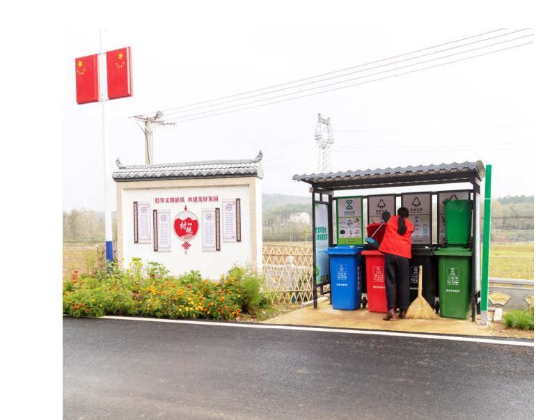
随州市开展“清洁家园”行动。