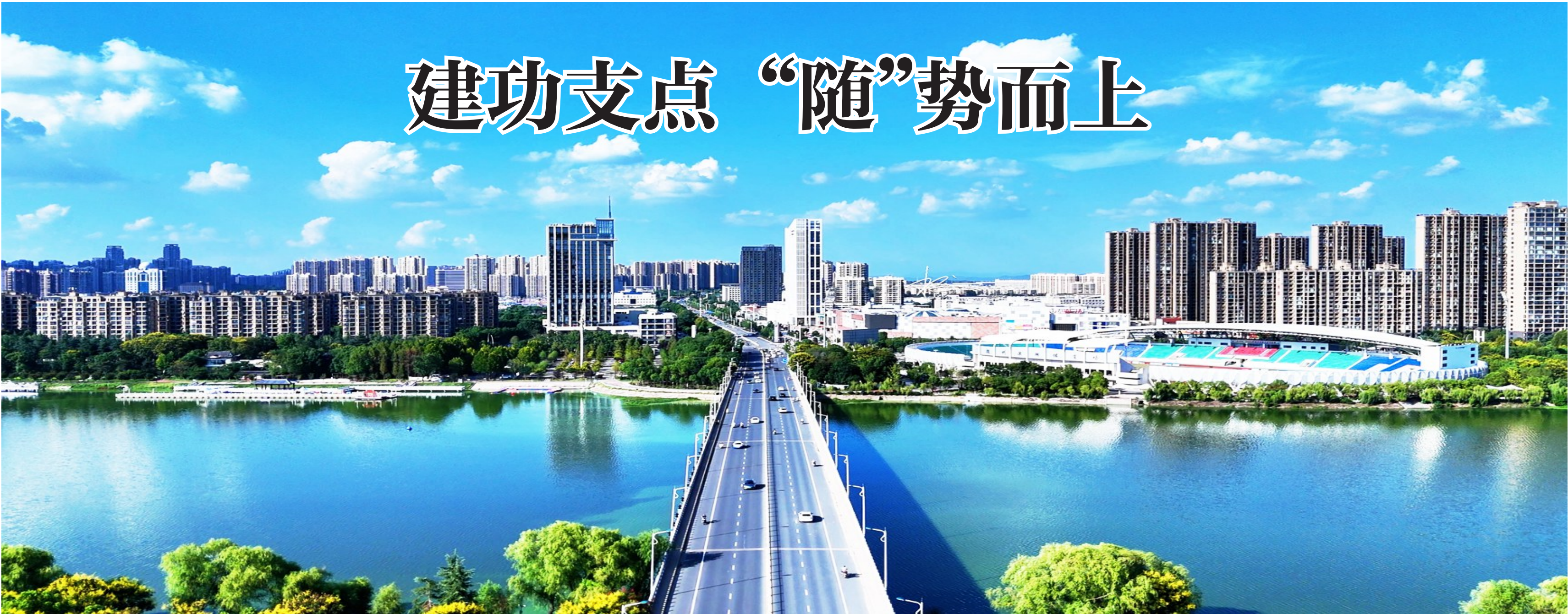
一幅宜居宜业宜游的和美画卷在随州徐徐展开。

策划：中共随州市委宣传部 撰文：张杰 张琴 刘诗倩 陈云