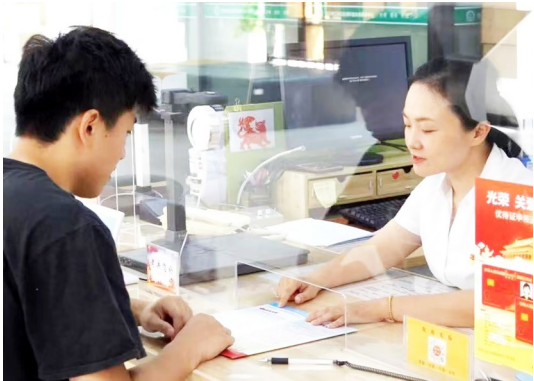
江岸区永清街道退役军人服务站窗口人员为服务对象解答政策。