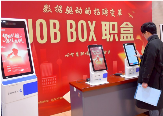
2025年武汉市春季专场招聘会,退役军人使用“1号智能求职机”便捷投递简历。