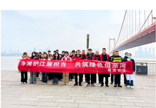
汉阳区“戎耀江城”退役军人志愿服务队联合多部门开展巡江净滩活动。