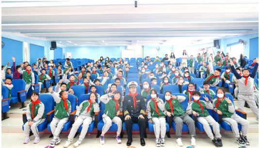
武汉市“老兵宣讲团”走进武昌区未来实验小学。