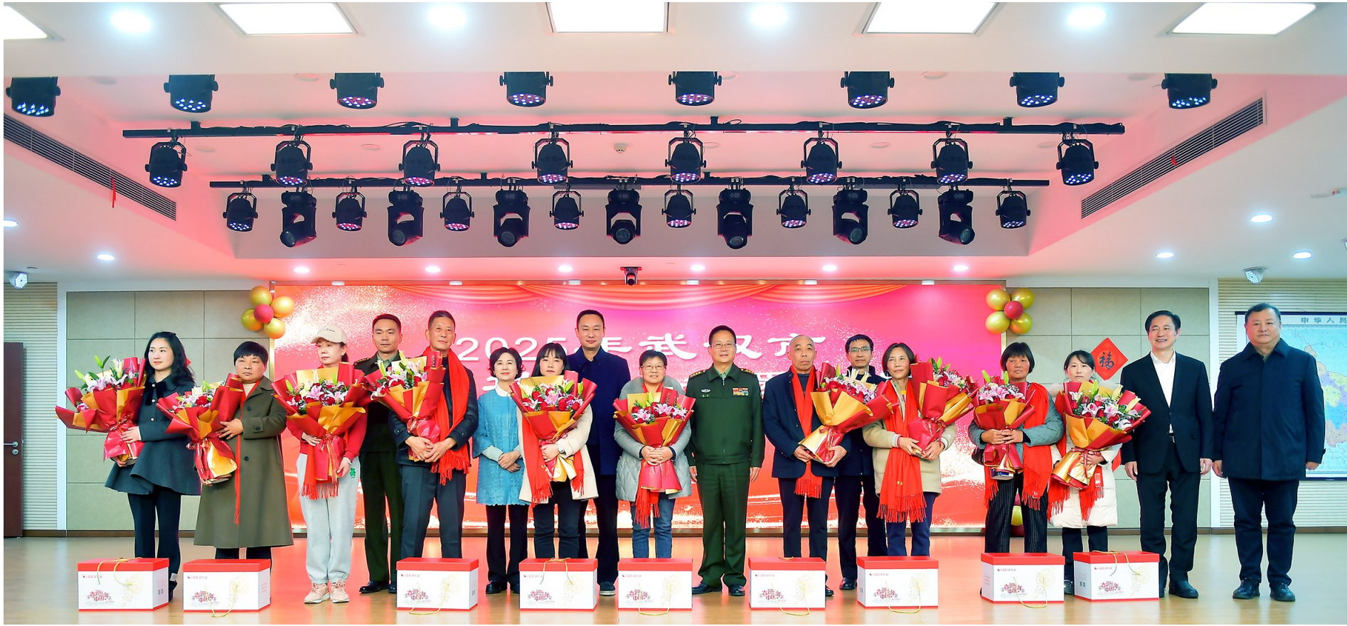
2025年武汉市“致敬功臣·关爱军属”活动现场。

武汉市建立困难退役军人动态帮扶台账,开展“情系老兵·温馨暖心”活动,2025年以来为300名生活困难、患重大疾病、遭遇重大变故的退役军人送去慰问金和慰问品,为573名在乡复员军人、“三属”人员购买“福汉康”医疗保险。蔡甸区关爱退役军人协会携手武汉海科集团,走进19名困难退役军人的家中,送去米、油、牛奶等生活物资与满含敬意的慰问信。经开区全面落实军地互办实事“双清单”制度,先后投入财政资金500余万元,为3个驻区武警部队进行训练场设施及营房维修和篮球场、训练场、食堂改造。纪念抗战胜利80周年之际,市退役军人事务局联合市关爱退役军人协会成立13个慰问组,走访38名抗战老兵,送上包含慰问信、慰问金、体检卡、生鲜礼盒的“尊崇礼包”,录制13期口述历史影像,让英雄故事代代相传。此外,武汉市退役军人事务局配合湖北省退役军人事务厅开展“退役军人助学行动”“劲牌行动”等专项慰问,惠及435人次。