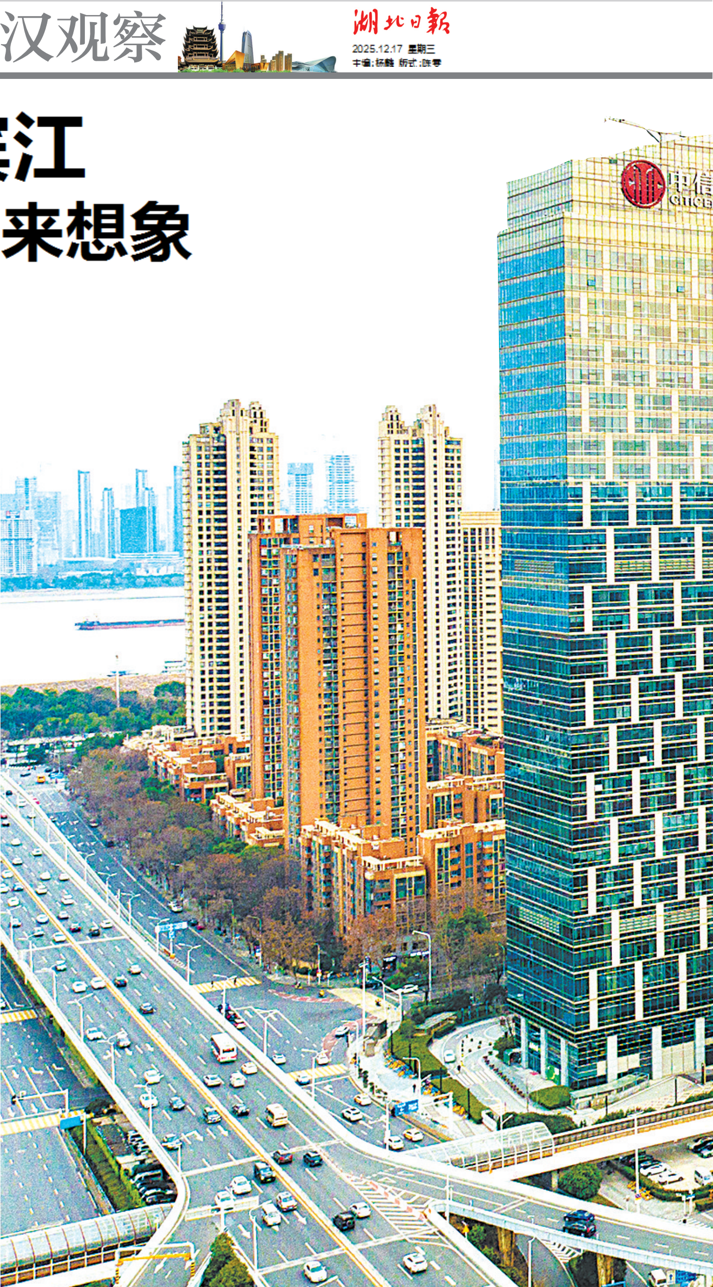
航拍武汉天地商务集群,亿元纳税楼在这里聚集。

“一城三廊一带”是武汉通过优化空间载体,提升创新体系整体效能的新布局。“一城”指东湖科学城,侧重于策源能力突破,打造原始创新高地。“三廊”指光谷科技创新大走廊、车谷产业创新大走廊、武汉滨江数创大走廊,侧重发挥出廊道的延展性特点,以点带面、沿线铺开,形成全城布局,推动科产融合,打造产业创新高地。“一带”指环大学创新发展带,以它盘活武汉的高校资源,吸引高校师生就近创新创业,打造成果转化载体。