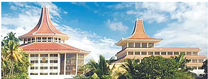
斯里兰卡高等法院大楼全面维修项目