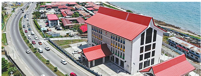
所罗门群岛国家转诊医院综合医疗中心项目