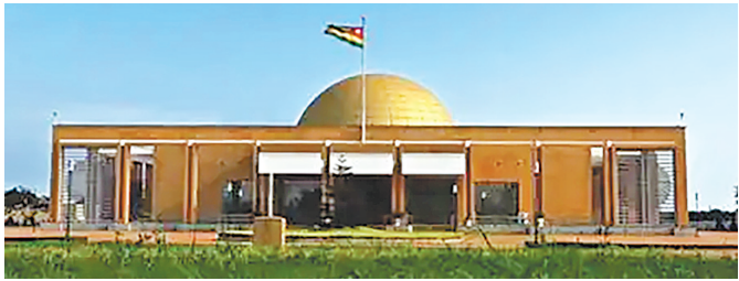
多哥总统府维修扩建项目