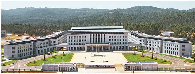
埃塞俄比亚领导力学院一期项目