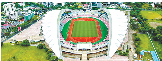
哥斯达黎加体育场升级改造项目