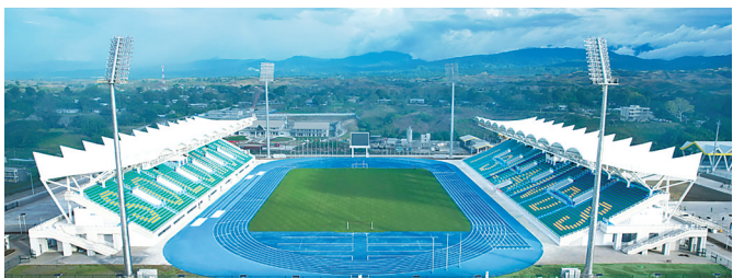
所罗门群岛2023年太平洋运动会体育场项目