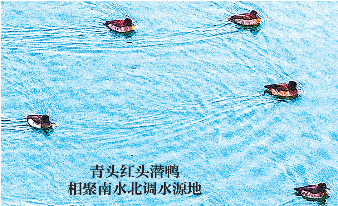
12月8日,十堰市郧阳湖国家湿地公园,十几只青头潜鸭在觅食嬉戏。

会议以视频形式召开,省政协秘书长涂远超主持会议。九三学社湖北省委和宜昌市、孝感市、黄冈市、南漳县、赤壁市政协负责同志作交流发言。