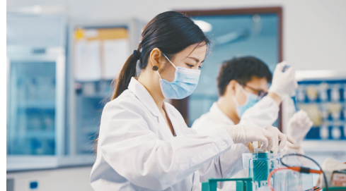
武汉体育学院学生正在做运动医学蛋白印迹实验。