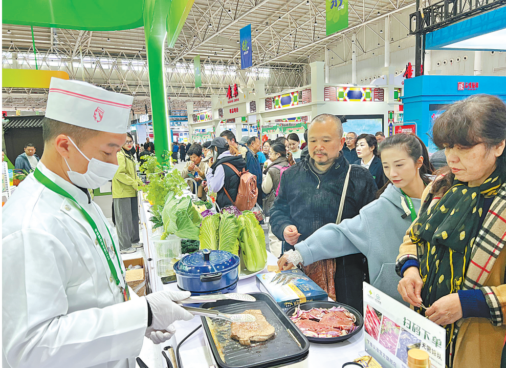
2025湖北农业博览会上，湖北供销冷链联盟进口优品展示区，消费者排队试吃。(受访单位供图)