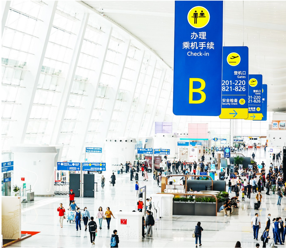
武汉天河国际机场。