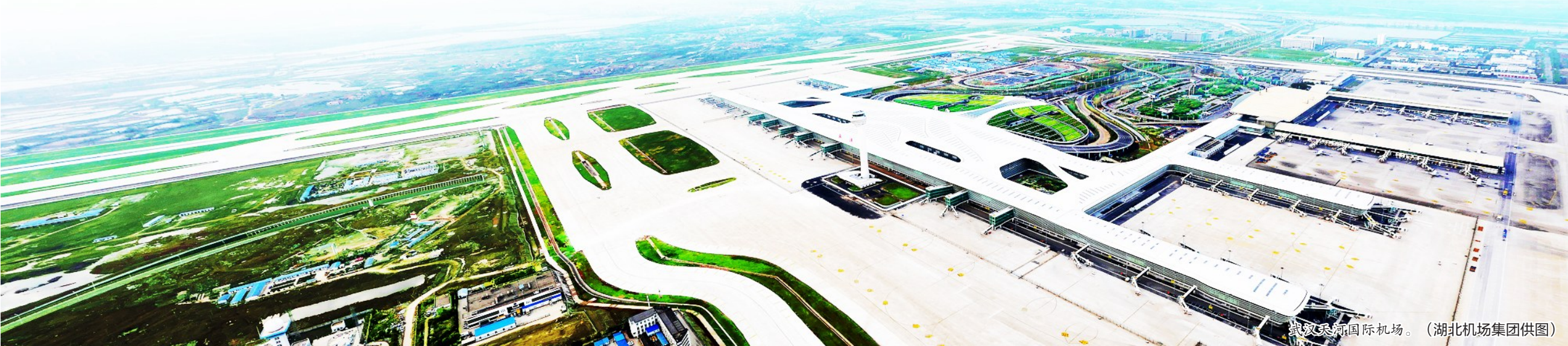
武汉天河国际机场。

站在新起点,武汉市将深入贯彻落实党的二十届四中全会精神、湖北省委十二届十一次全会精神,按照省委、省政府,市委、市政府部署要求,深化交通强国建设试点成果,以更大力度建强中部地区大通道、大枢纽,持续完善现代化综合交通运输体系,为奋力推进中国式现代化武汉实践、加快建成中部地区崛起重要战略支点当好开路先锋!