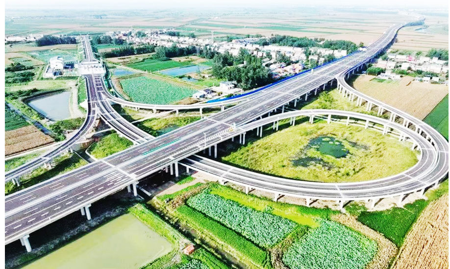
武松高速消泗互通。

枢纽功能前置延伸,开创“家门口出海”新范式。光谷城市货站的创新运营,实现了武鄂“两场”海关互认、安检前置。企业在货站完成通关,货物即可直通机场装机,开创了三地“货物直通、互为前置”的新模式。自去年8月运营以来,已发送货物643万件,货值突破3800万美元,通过新增安检通道、航空专用驳运车,货物处理能力从日均15吨提升至140吨,服务效能提升9倍,让光谷的高新技术企业足不出户便能高效连接全球市场。