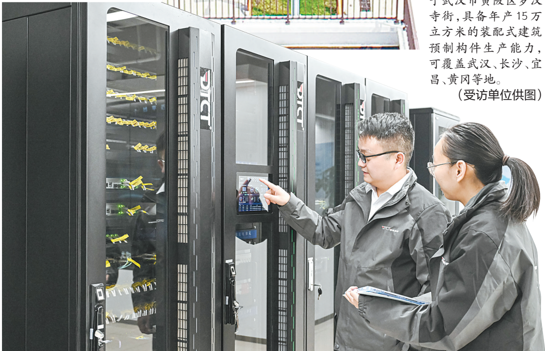
德塔森特(武汉)数据科技有限公司的技术人员正在巡护设备。