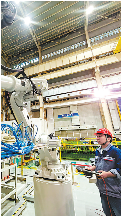
正泰电气(武汉)工厂二期加速投产。

今年以来,伴随全球电网大规模更新换代,加上算力的扩张,引爆了变压器天量大额定单。正泰电气武汉工厂截至10月底已实现产值16亿元,年度有望突破20亿元,销售额呈现爆发式增长。