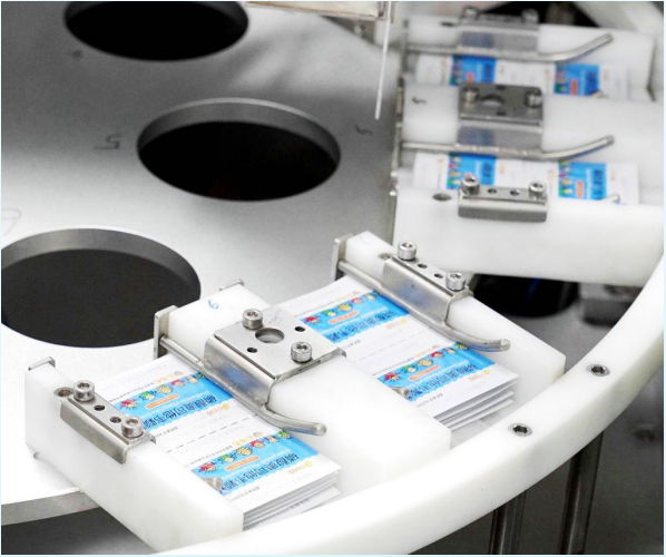
奥司他韦颗粒剂制生产线上。