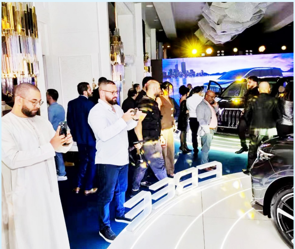
5月9日,岚图汽车在阿联酋举行品牌发布会,受到中东用户的围观。