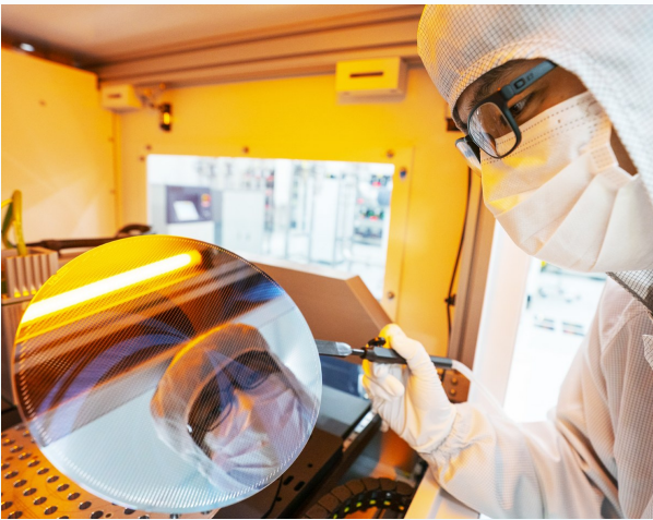
九峰山实验室,科研人员在检查芯片晶圆完整度。

全国试点,以人工智能赋能专利转化全流程。推动我省高校1413件“双五星”专利与9700家企业需求精准匹配。三峡大学以智能减振提升效率、产业链专场精准对接等方式破解“专利找不到企业”难题,专利转化数量保持连续的增长态势,2025年专利转化数量同比2024年增长40%,其中与安琪酵母联合申报的专利,为企业带来新增产值3.9亿元。