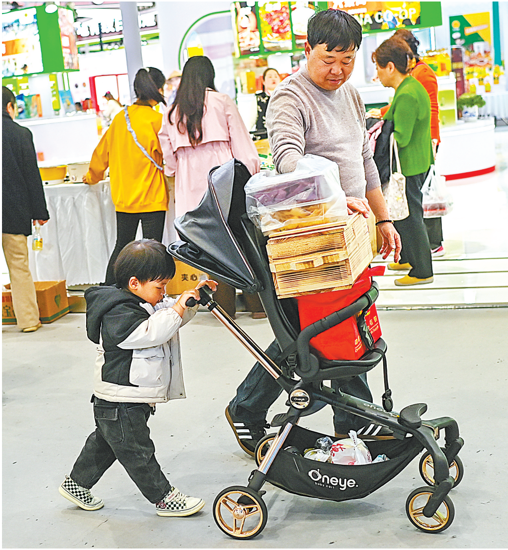
12月1日,2025湖北农业博览会开展的第四天,市民“边吃边买”热情高涨,儿童车里装满了购买的商品。

在高产高蛋白玉米展位,来自新疆伊犁的吕大爷捧起玉米棒端详。听闻未来科技工作人员介绍,该玉米蛋白含量达13%、成熟期籽粒含水