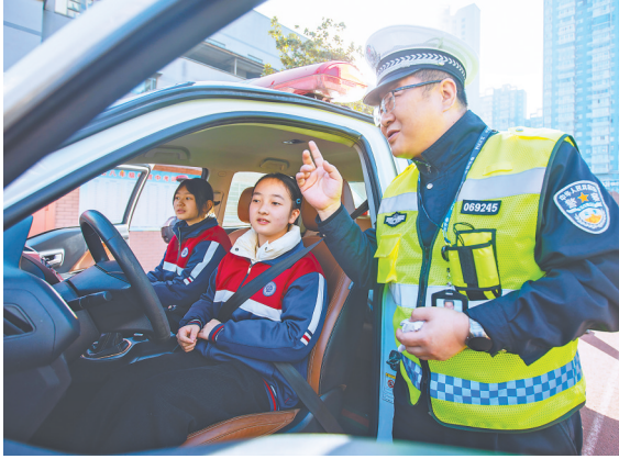
11月28日,民警教同学们认知车辆盲区。当日,襄阳市诸葛亮中学开展全国交通安全日主题活动,民警通过安全头盔规范佩戴实操、交通标识趣味识别、汽车盲区实景认知等形式,让同学们在互动参与中上了一堂“交通安全实战课”。

11月28日,民警教同学们认知车辆盲区。当日,襄阳市诸葛亮中学开展全国交通安全日主题活动,民警通过安全头盔规范佩戴实操、交通标识趣味识别、汽车盲区实景认知等形式,让同学们在互动参与中上了一堂“交通安全实战课”。