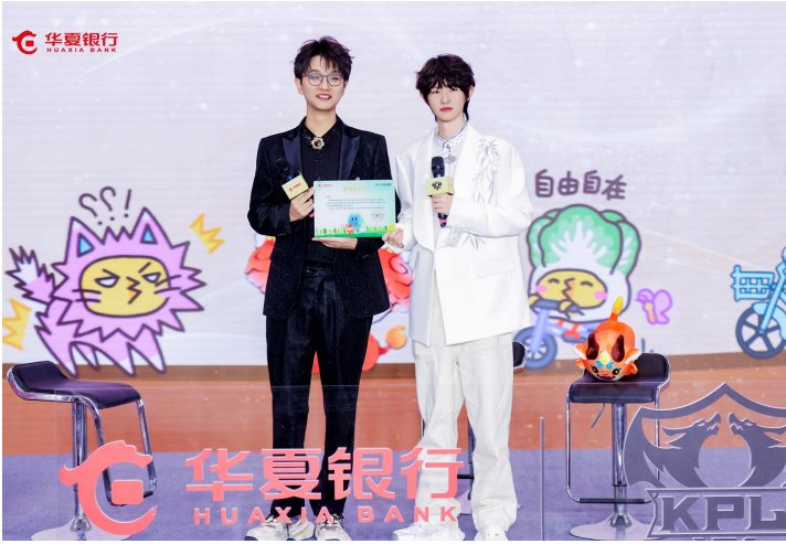
2025年11月24日，华夏银行武汉分行在汉举办KPL王者荣耀战队联名卡发卡周年庆典“壹起热爱 共赴荣耀”成都AG超玩会一诺、CAT粉丝见面会。