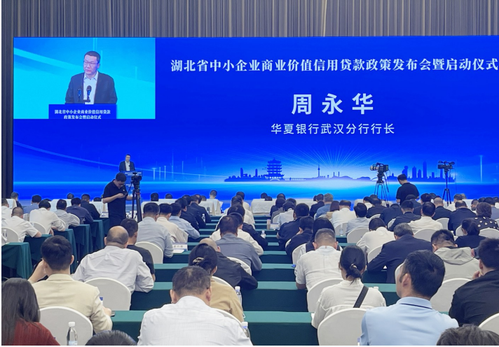
2025年4月，华夏银行武汉分行入选湖北省中小企业商业价值信用贷款首批合作银行。

数字见证担当。截至2025年9月末，华夏银行武汉分行普惠贷款余额近100亿元，较年初稳步增长。从破解小微企业融资难题，到推进乡村振兴战略，华夏银行武汉分行正以普惠之光，照亮千企万户的梦想之路。