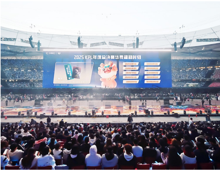
2025年11月8日，华夏银行以王者荣耀职业联赛官方指定银行合作伙伴亮相2025年KPL年度总决赛（北京国家体育场·鸟巢）。