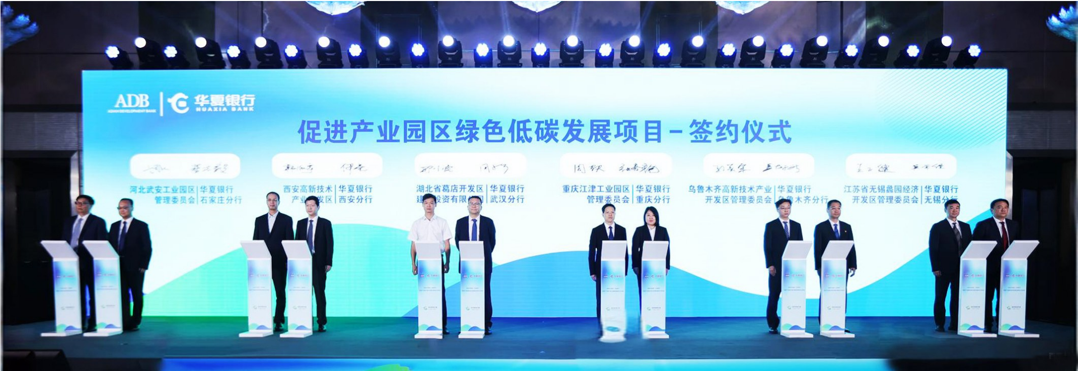
2025年6月，华夏银行与亚洲开发银行在北京联合举办“促进产业园区绿色低碳发展项目”启动会。

站在“十四五”圆满收官与“十五五”崭新局的历史交汇点，华夏银行武汉分行迎来成立26周年的重要时刻。作为扎根荆楚的金融生力军，华夏银行武汉分行始终秉持金融报国初心，以写好金融“五篇大文章”为着力点，持续加强对重大战略、重点领域和薄弱环节的优质金融服务，在助推湖北加快建设中部地区崛起重要战略支点的征程中，有力支撑湖北实体经济发展和民生改善；在新时代的赶考路上，以实实在在的作为谱写了高质量发展新篇章，刻下坚实的华夏印记。