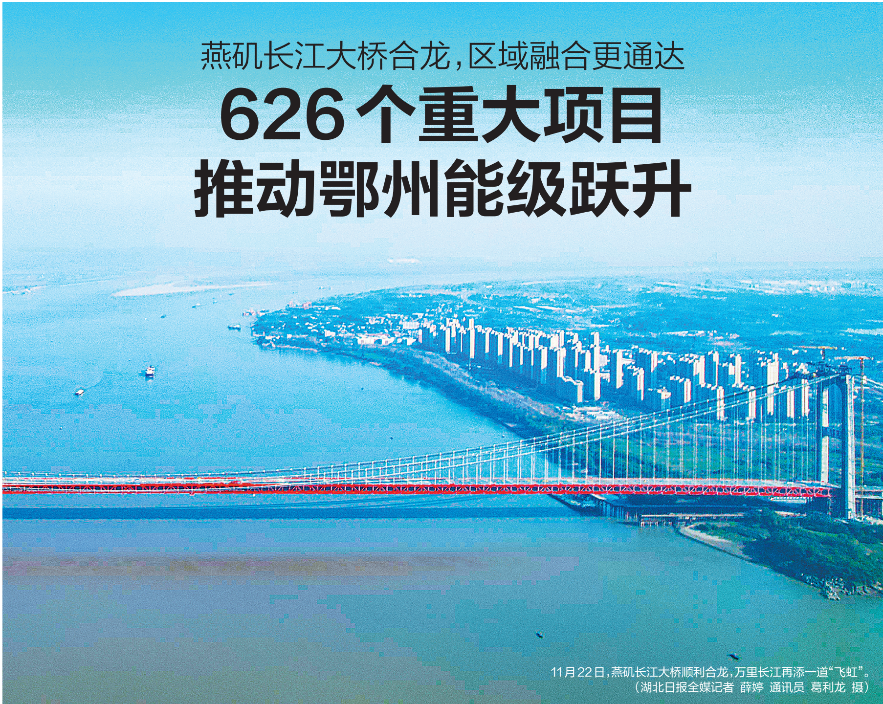
11月22日,燕矶长江大桥顺利合龙,万里长江再添一道“飞虹”。