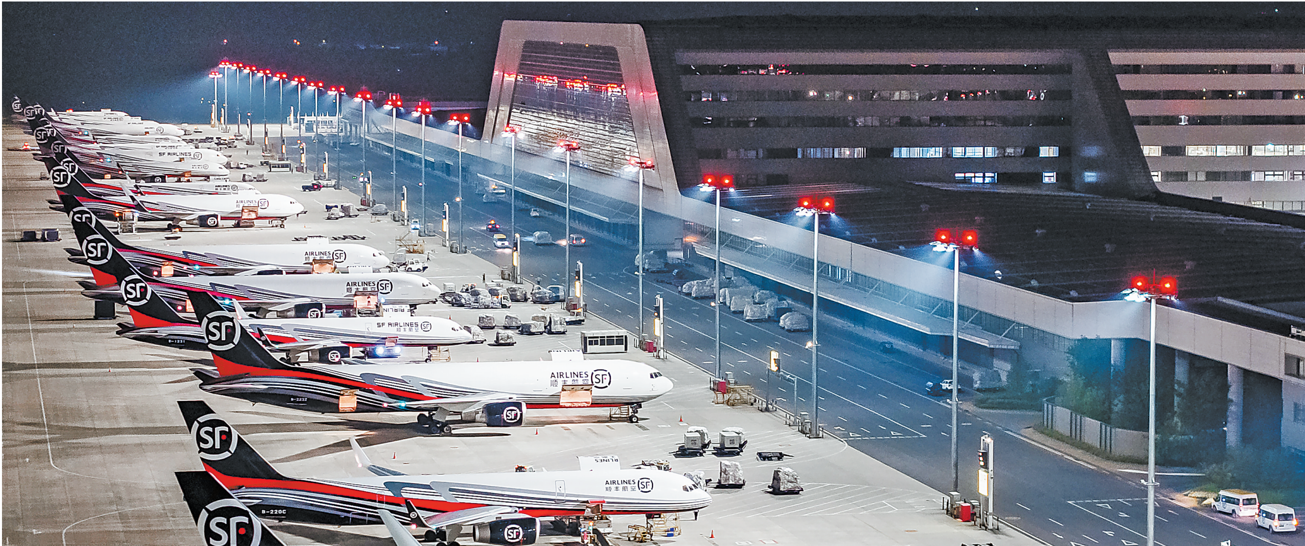
夜访花湖“不夜城”，超级枢纽迸发“超级运力”。