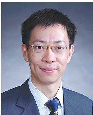
余森杰 国际经济学会院士、 辽宁大学校长