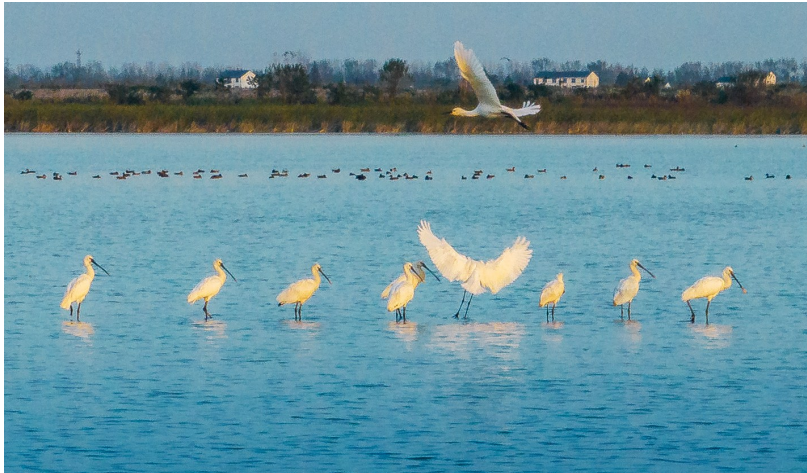
武汉沉湖湿地自然保护区,国家二级重点保护动物白琵鹭在水面栖息。