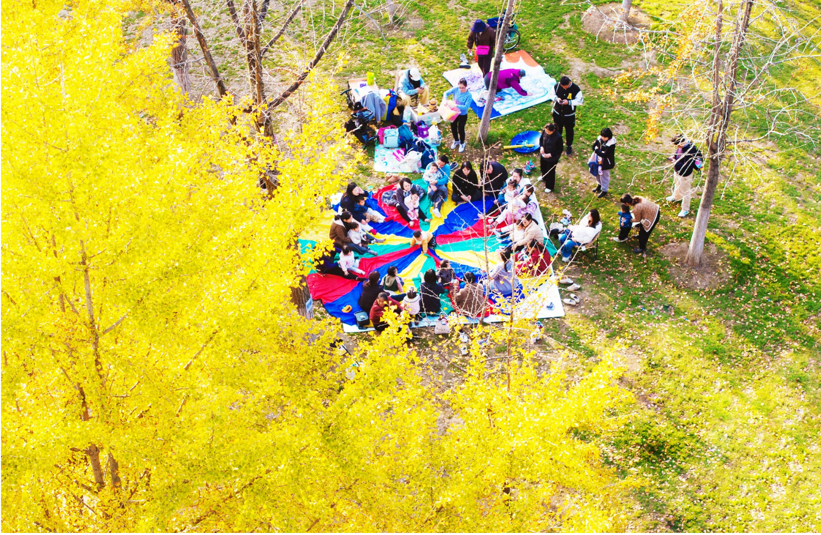
11月,解放公园银杏进入最佳观赏期。(受访单位供图)

“千万级人口大城可与自然共生共荣!”《湿地公约》秘书处副秘书长杰伊·奥尔德斯的由衷赞叹,道出了国际社会对武汉湿地保护实践的高度认可。