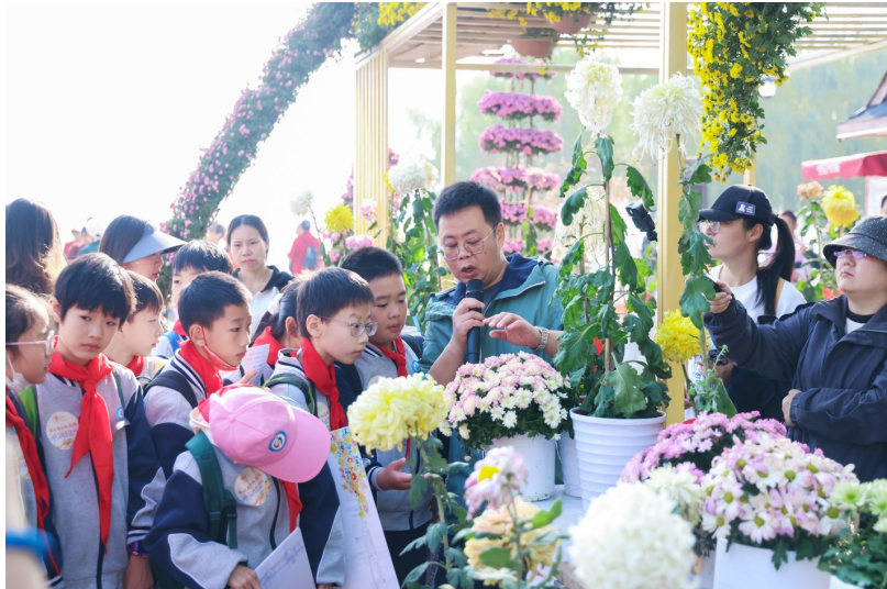
“揭榜挂帅”武汉特色菊花优品品种筛选及景观应用研究项目团队为青少年及市民普及菊花栽培、园艺鉴赏。

下一步,武汉市园林和林业局将以“揭榜挂帅”和“青苗”先锋队为抓手,持续营造实干氛围,推动科研攻关早出成果、青年人才茁壮成长,为厚植武汉生态底色、提升支点建设生态承载力提供坚实支撑。