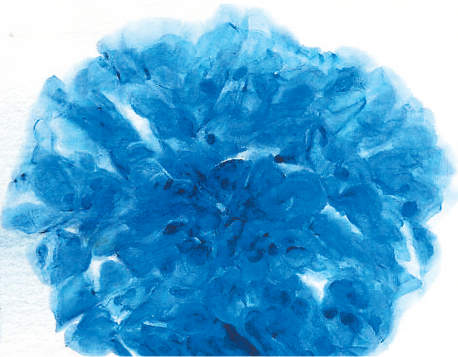
徐勇民《湛湛露斯》