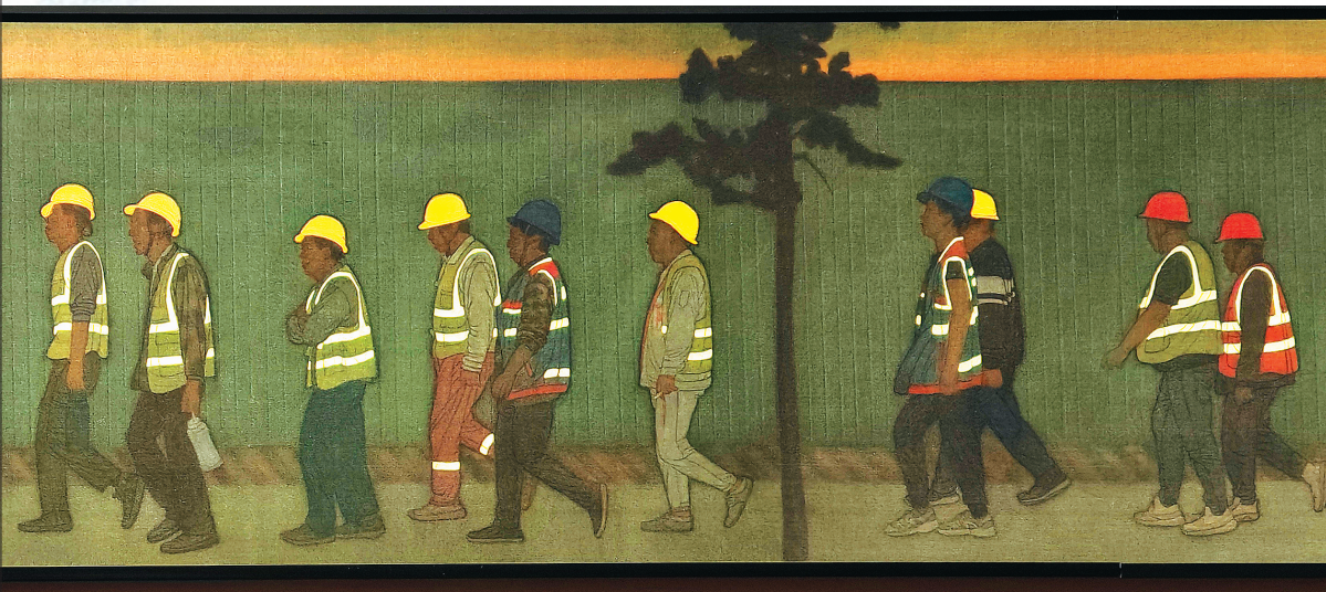
李传真《晨昏线 No.2》(局部)