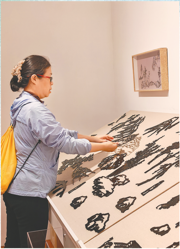
观众与《山水谱》互动