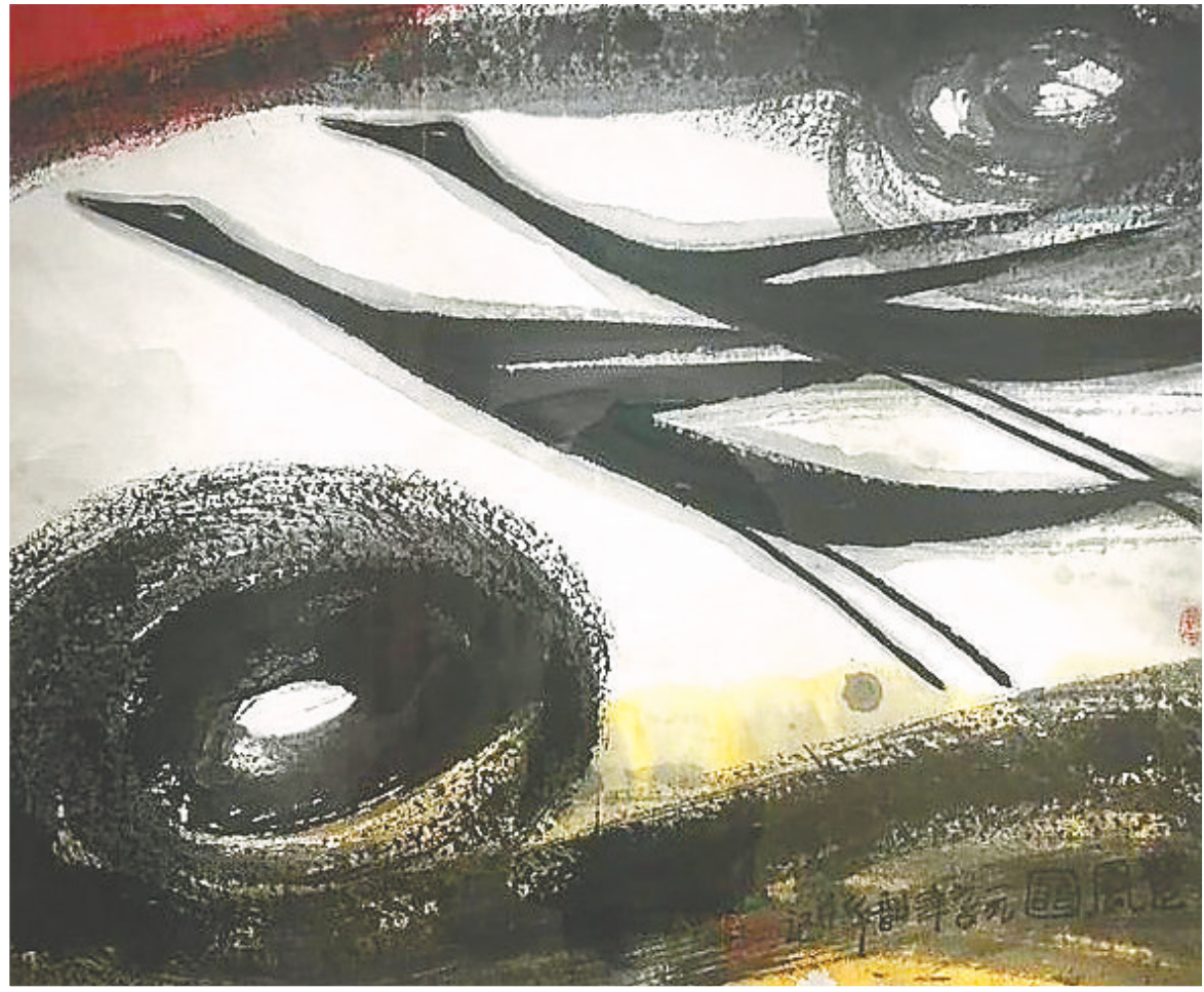
周韶华《楚风图》