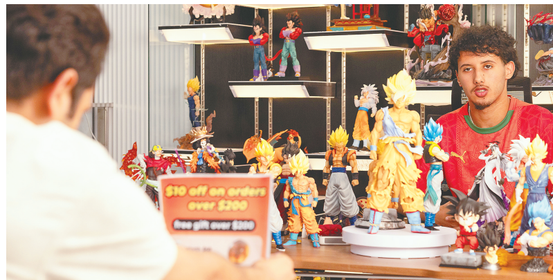
鄂州跨境电商产业园,来自巴基斯坦、摩洛哥的主播们在向美国粉丝推介Cosplay手办。

北京时间20时,南非时间14时。夜幕低垂,周边写字楼的灯光逐渐暗淡,位于高新大道的武汉长江国贸跨境电商产业园却灯火通明。(下转第3版)