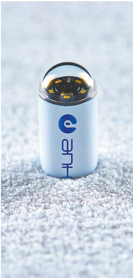
安翰科技自研的胶囊内窥镜。

研究显示，该智能阅片软件对消化道阳性图片识别的灵敏度可达99%以上，通过该算法医生诊断胃+小肠的平均阅片时间从96.6分钟缩短为5.9分钟，大大提高