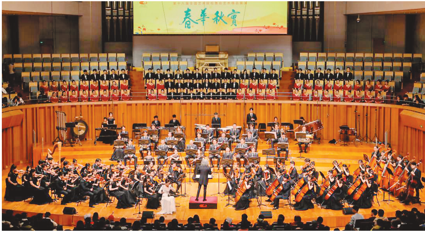
11月5日，武汉音乐学院原创交响组曲《永远的焦裕禄》演出现场。

在作品中，创作团队刻意打破单一视角，从焦裕禄同志本人、同事、亲人、群众等视角和亲情、友情、家国之情等角度，用不同音乐手法塑造了焦裕禄同志的人物形象，展现了焦裕禄同志的崇高品格，赞颂和弘扬了焦裕禄同志的伟大精神。“这部作品将时代性、民族性、地域性完美融