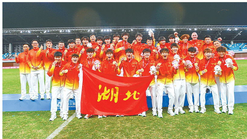
湖北男足第一次站在了全运会的冠军领奖台上。

湖北日报讯(记者蔡毅、通讯员吕鑫)历史性突破! 11 月 12 日晚,在深圳进行的第十五届全运会男足 U20 组决赛中,湖北队与广东队在常规时间战成 1 比 1,30 分钟加时赛双方均无建树,在最终的点球大战中,湖北队以 5 比 3 取胜,从而以总比分 6 比 4 战胜东道主,勇夺冠军! 这也是湖北男足第一次站上全运会最高领奖台。在