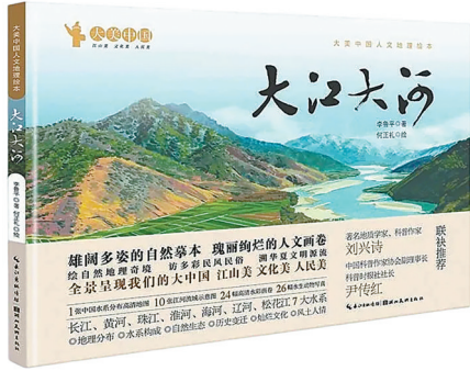
《大美中国人文地理绘本·大江大河》封面