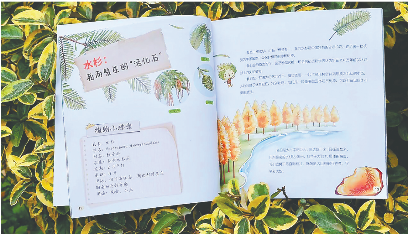
书籍内页。

水杉是怎么“死而复生”的？为什么莲子的寿命能达千年？“橘”“桔”“橙”“柑”又有什么关系？这些藏在草木间的疑问，中国科学院武汉植物园科普团队打造的《植物里的中国故事》，都能给你趣味答案！