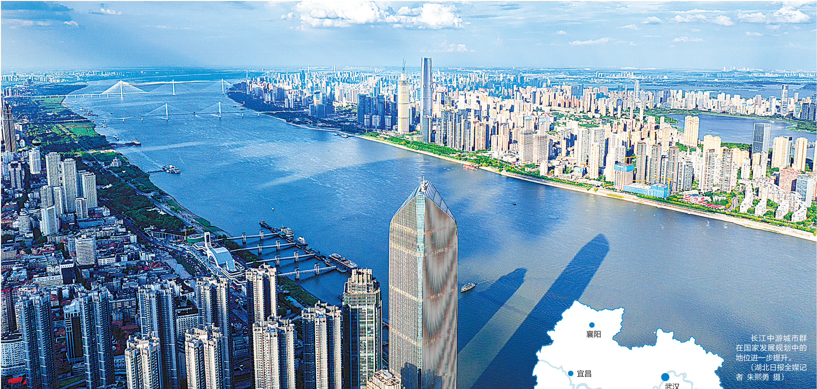
长江中游城市群在国家发展规划中的地位进一步提升。