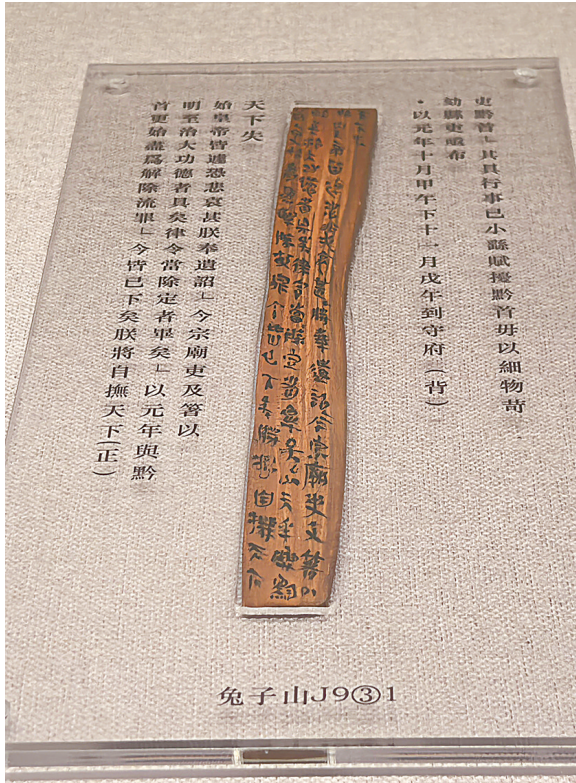
兔子山遗址秦牍《秦二世胡亥诏书》 湖南省文物考古研究院藏。