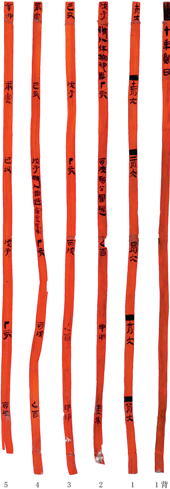
睡虎地汉简《十年质日》 湖北省文物考古研究院(湖北考古博物馆)藏。