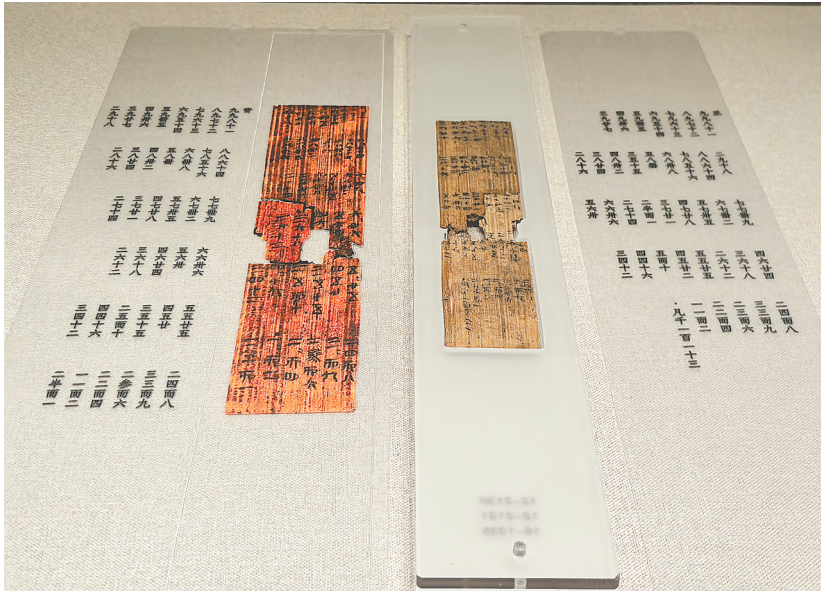
里耶秦简《九九表》木牍 龙山县里耶古城(秦简)博物馆藏。