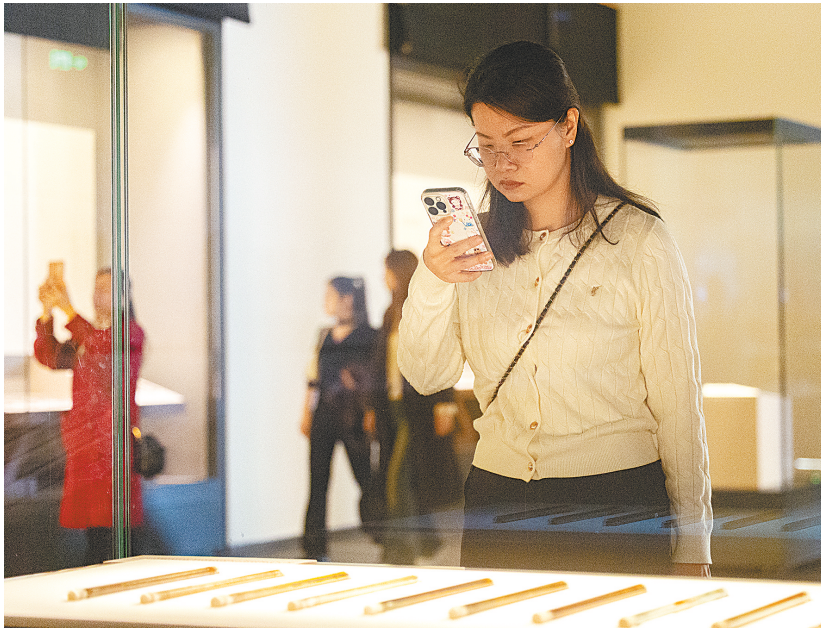
观众在简牍展品前驻足拍照。