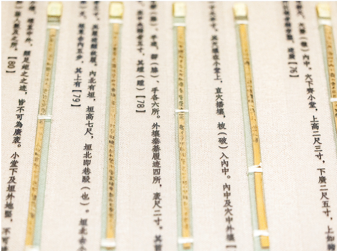
展出的睡虎地秦简《封诊式》“穴盗”篇。(湖北日报全媒记者 何宇欣 摄)

从战国至东晋,从楚地、秦中到三国吴地、西域边塞,从典章制度到社会百态、人间烟火,这些出土于墓葬、古井、遗址的千年竹木,生动展现了中华民族波澜壮阔的文明演进和多元一体的文明格局。