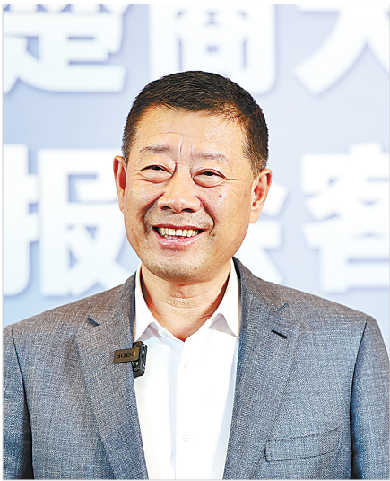
黑龙江龙商总会会长、 中国飞鹤有限公司董事长 冷友斌