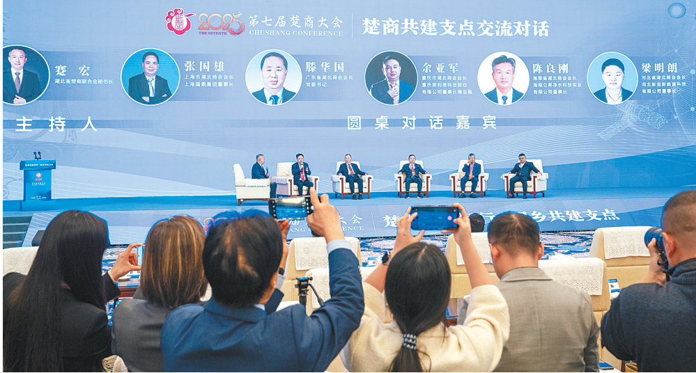
上海、广东、重庆、海南、河北等湖北商会会长对话交流。

“没有落后的产业，只有落后的企业。”重庆市湖北商会会长、重庆美利信科技股份有限公司董