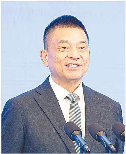
川商总会会长、 新希望集团董事长 刘永好