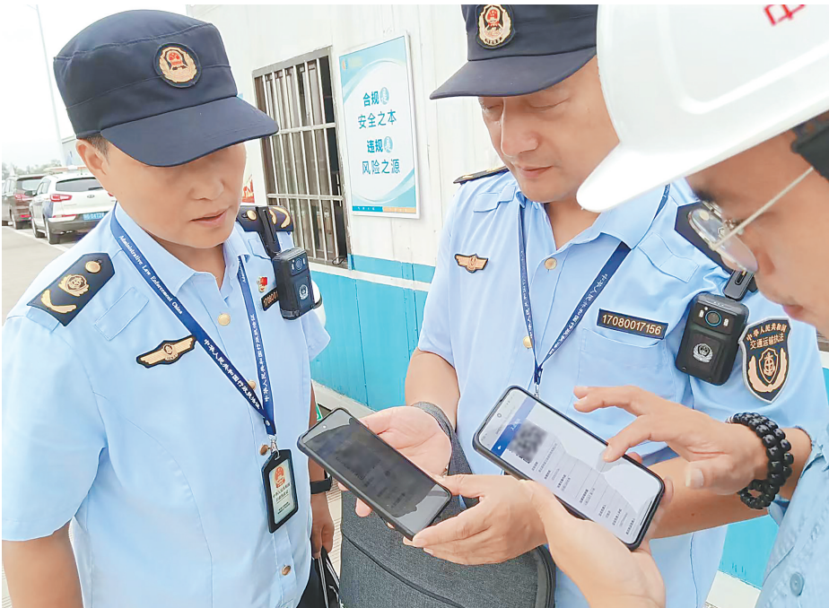
鄂州市交通运输综合执法支队执法人员到鄂州市某公司开展入企检查,执法人员亮证检查。

式,以税务部门“个人所得税”征管数据为核心,结合企业工资发放台账、银行流水记录等多维度证据材料,通过交叉比对、相互印证的方式,对行政相对人上一年度收入情况进行精准核定,确保行政处罚基准客观、准确、合法。