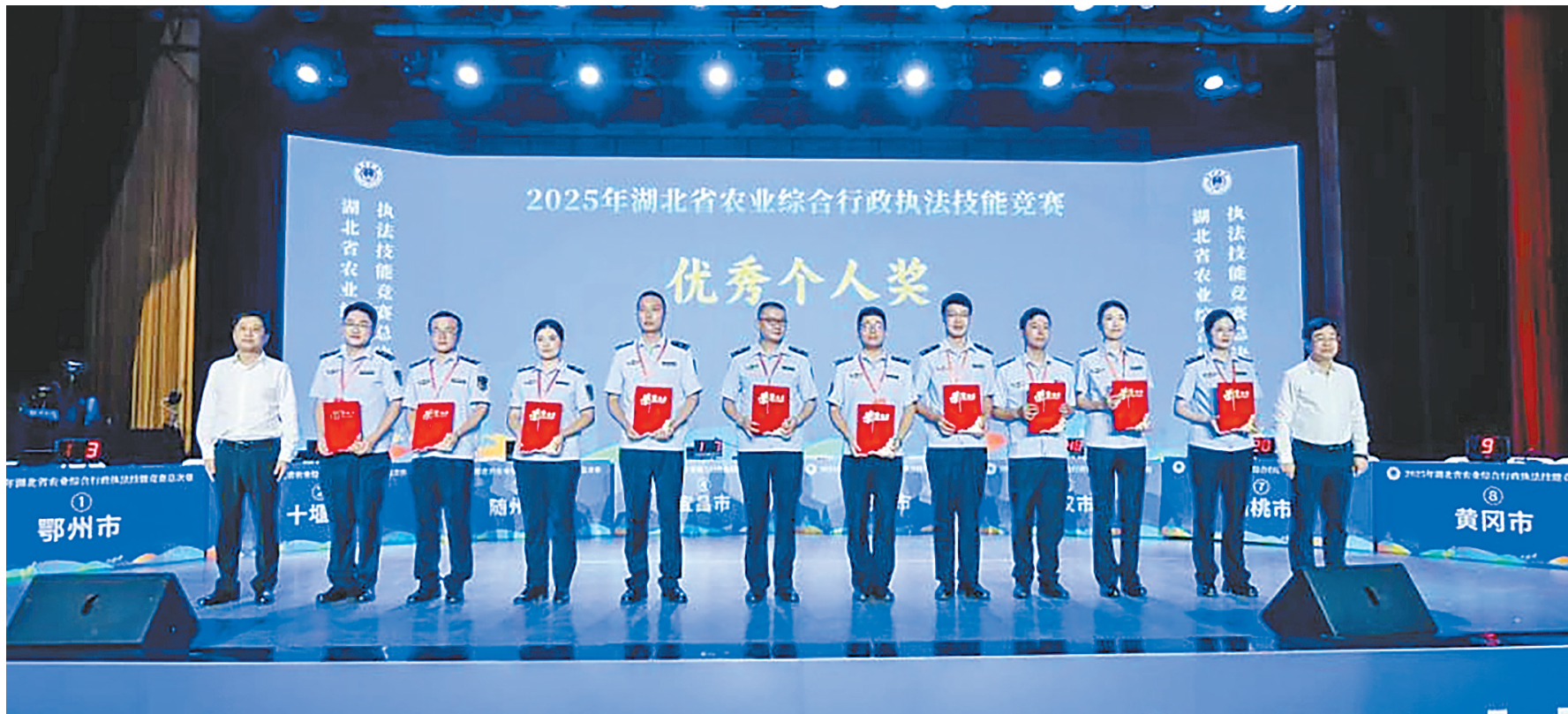
省农业农村厅、省司法厅、省总工会、团省委、省妇联联合举办湖北省农业综合行政执法技能竞赛。

省司法厅有关负责人表示,规范涉企行政执法专项行动开展以来,各地各部门聚焦乱收费、乱罚款、乱检查、乱查封,违规异地执法和趋利性执法等企业反映强烈的突出问题,强化执法监督、加强协调联动、加大纠治力度,着力推进严格规范公正文明执法,切实维护企业合法权益,持续优化营商环境,形成了一批好的案例。这些案例充分展现了湖北各地在规范执法行为、优化涉企服务等方面的创新做法,具有很强的示范引导作用,值得借鉴推广。