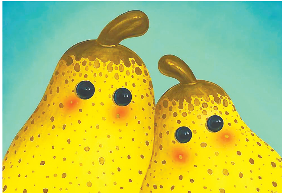
张超级 永不分裂——二梨同心 80cm×100cm 布面丙烯 2024

“大艺博不仅是短短数日的展会,更是推动艺术进入生活的力量。”主办方表示,期待通过这场盛会,让武汉市民零距离触摸艺术之美,让全球青年艺术家的才华被更多人看见。