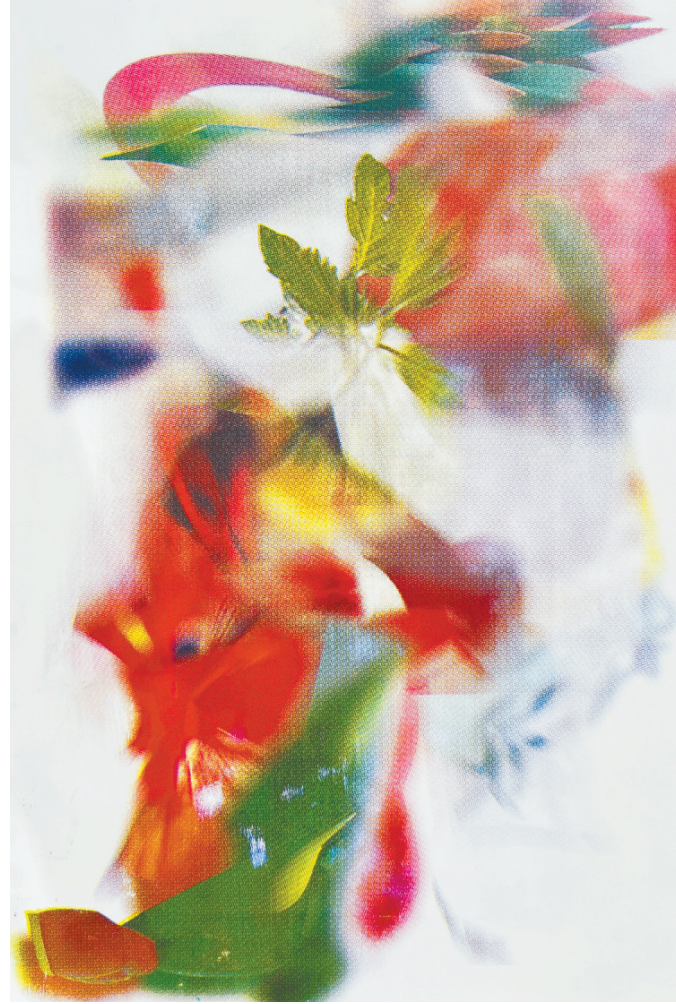
彭家乐 认知七 91cm×65cm 版画丝网版 2024 日本东京艺术大学