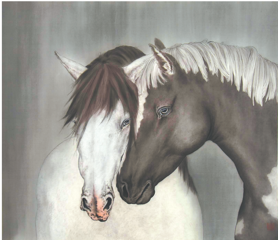
高枋根 依偎 65cm×75cm 国画 纸本水墨 2024 四川美术学院