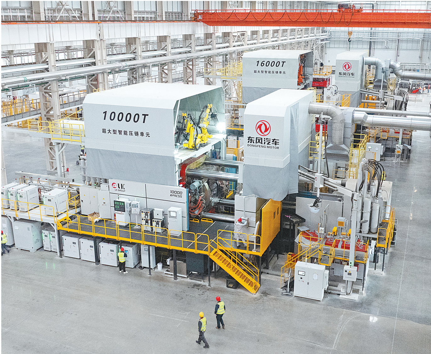
东风汽车一体化压铸工厂。