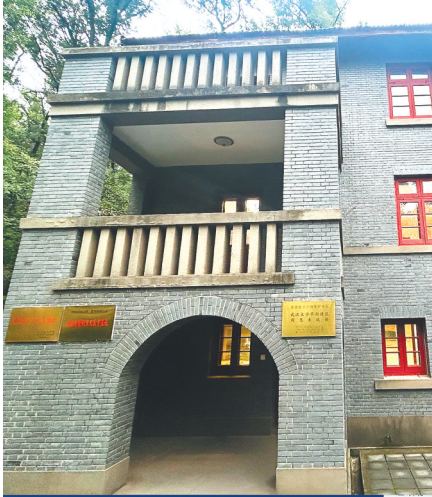
武汉大学珞珈山“十八栋”周恩来故居。

今天,“十八栋”周恩来旧居已修缮为纪念馆,向大学生和社会游客开放。珞珈山风掠过林梢,站在“十八栋”平台远眺,东湖水依旧浩渺。