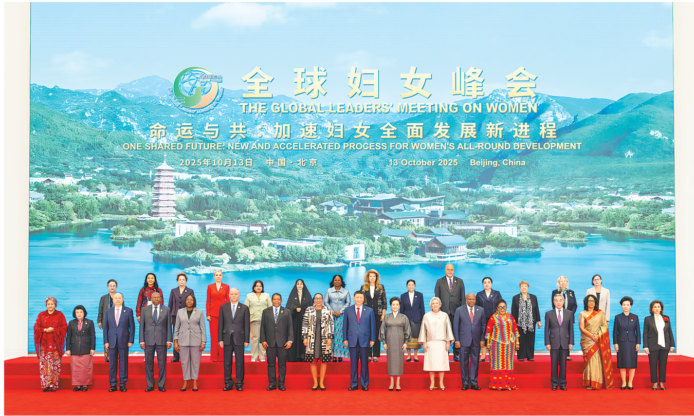
十月十三日上午,国家主席习近平在北京国家会议中心出席全球妇女峰会开幕式并发表主旨讲话。这是习近平和夫人彭丽媛与会各国和国际组织代表团团长夫人合影留影。