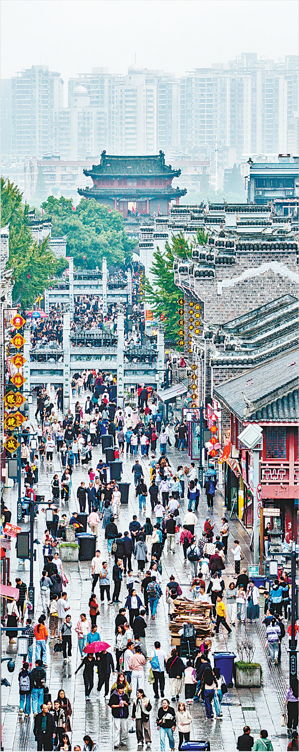
10月6日，历史悠久的襄阳北街人潮涌动。

国庆中秋双节期间，湖北各地以精细服务为关键词，从一杯热饮到免费停车位、惠民餐食等，用有温度的举措让八方游客感受到湖北式待客之道。 针对外地游客停车难，十堰市郧阳区免费开放停车位泊位6436个，房县西关印象景区地上地下停车场全部免费；武当山景区加密旅游公交班次至10分钟一班，调配230辆景交车、50辆出租车，开放2万个停车位。 国庆中秋假期，襄阳交管部门对五类交通违法行为免罚（如外地车误闯禁行、夜间非主干道有序停放等），并提供五项服务：襄阳交管车驾管业务线上线下全时办理、交通事故视频快处、货车通行证正常审批、景区路段单边停车、开放单位车位共享，全力保障假期出行便利。 针对外地游客吃饭贵的问题，赤壁市政府机关食堂贴心推出18元五菜一汤，免费续加，免费提供青砖茶、月饼，网友称为“最划算的旅行套餐”。黄冈市黄州区区委机关食堂推出15元四菜一汤，菜品涵盖东坡肉、黄州包面等地方特色。 在古隆中景区，工作人员雨中递上的姜丝可乐成为游客朋友圈的“暖心打卡点”。这一暖心举措迅速登上游客朋友圈，成为景区最受欢迎的打卡点。来自武汉的游客鲍女士表示：这杯姜茶不仅驱散了寒意，更让广大游客感受到襄阳的热情。 在恩施大峡谷，景区在关键点位设置7处“峡谷小新”志愿服务站，免费提供姜汁可乐、红糖水、矿泉水、零食及应急药品，免费送出早餐包超12000份，全程守护游客游览体验。 2025“河山添锦绣”文旅IP武汉城市大巡游中，现场因游客爆满导致信号中断，买水时手机支付受阻。一位店家老板暖心表示：“不要紧的，直接拿就行了；没有信号就算了，没关系；如果是确实扫不出来，就拍个照片，凭良心付款。” 为助力旅客返程，10月8日，国铁武汉局在汉十高铁、郑渝高铁、汉宜铁路等线路和去往成渝、沪杭等热门方向加开309列始发旅客列车，其中在广州、宜昌和襄阳等方向加开127列夜行高铁；并将去往深圳、青岛和宜昌等方向的35列动车重联开行，最大限度满足旅客返程需求。 暖心服务，赢得网络空间好评如潮。有网友感慨地说，这就是湖北，美丽又温暖，来了还想来。